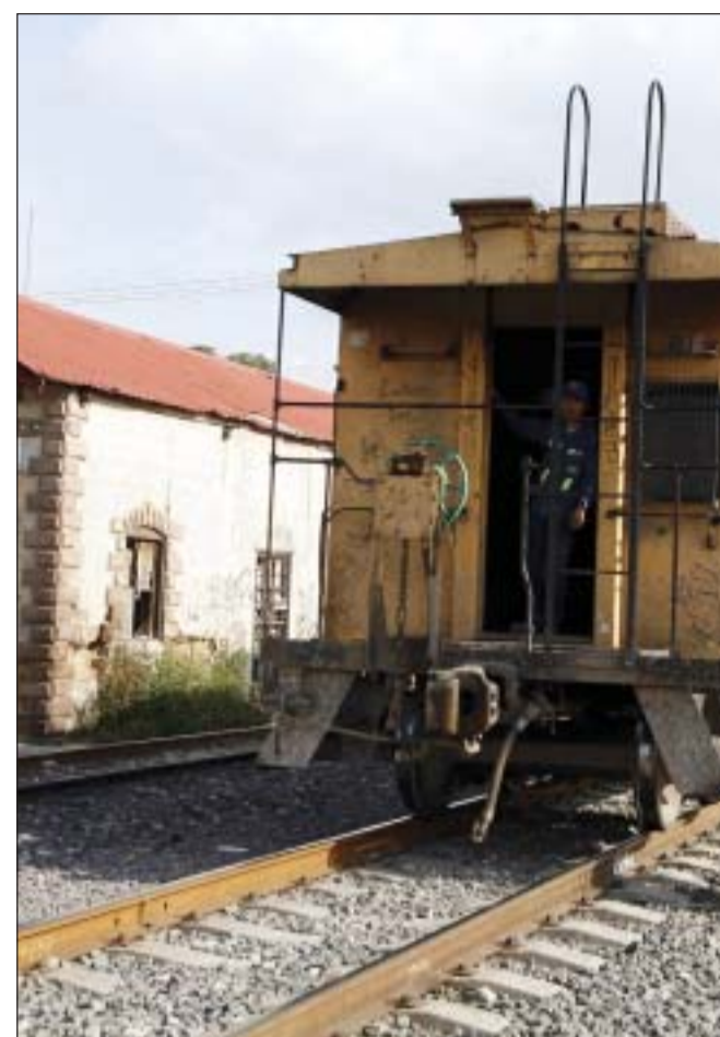
Las estaciones de ferrocarriles podrían desaparecer, advierten.