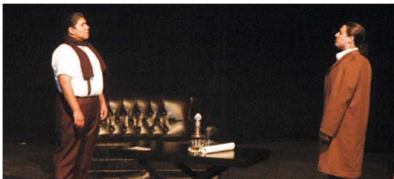
La obra La Muerte del Caballo se presentó con gran éxito este fin de semana.

La Compañía Alvéolo Teatro busca difundir la dramaturgia mexicana a través de la obra recién presentada a través de transportar al espectador a un mundo en el que todo es posible y en la que la misma fantasía cobra vida.