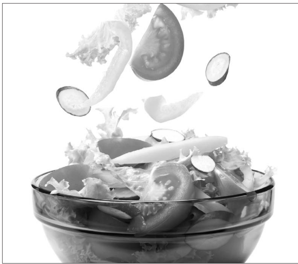
La muy famosa ensalada rusa fue concebida por un cocinero de origen francés que se estableció en Moscú.

Si acuden al Diccionario, se encontrarán con algo muy poco frecuente: no sólo se atreve a definir una voz relacionada con la gastronomía y la cocina, algo insólito, sino que hasta apunta una receta Cutre.