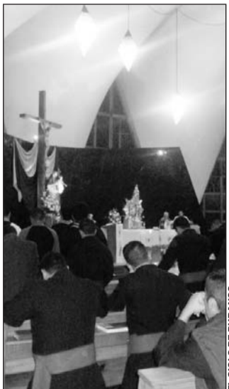
Actividad. Un total de 105 jóvenes participaron en Pre Seminario organizado por la Arquidiócesis de Durango.

Además, explicó que el equipo formador integrado por ocho sacerdotes, tiene la capacidad de identificar a