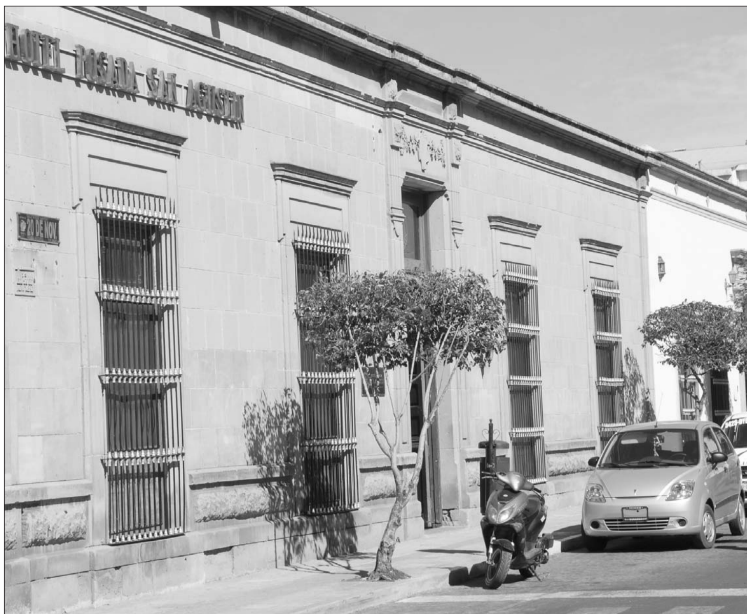
Visitantes. La Secretaría de Turismo informó que se tiene una ocupación del 80 por ciento en Durango, derivado del periodo vacacional y de las fiestas de la ciudad.