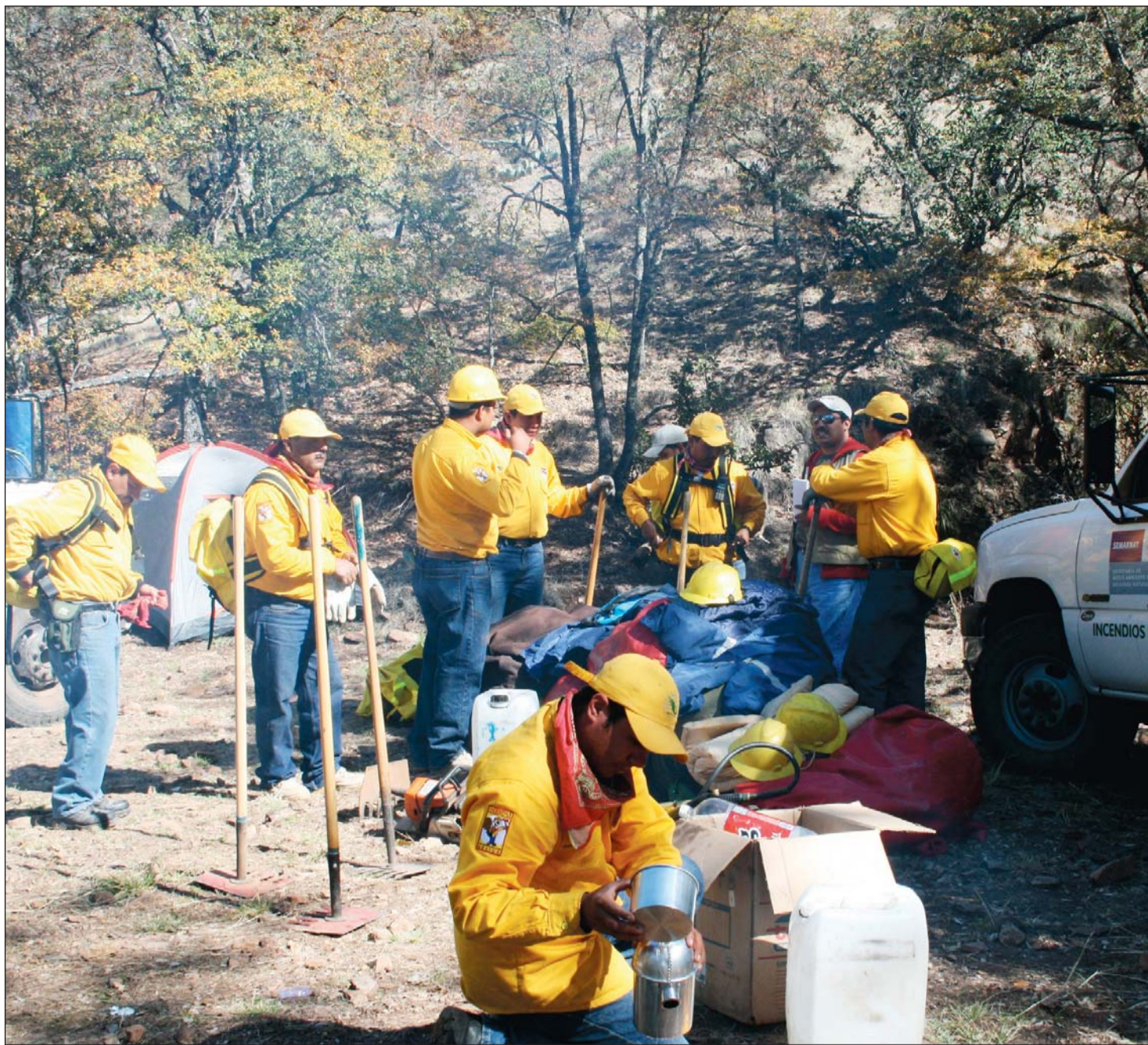
Atención. El tiempo promedio que tardaron en llegar a la zona afectada por las deflagraciones fue de una hora con 40 minutos aproximadamente; mientras que en sofocarlo fue de unos 25 minutos.