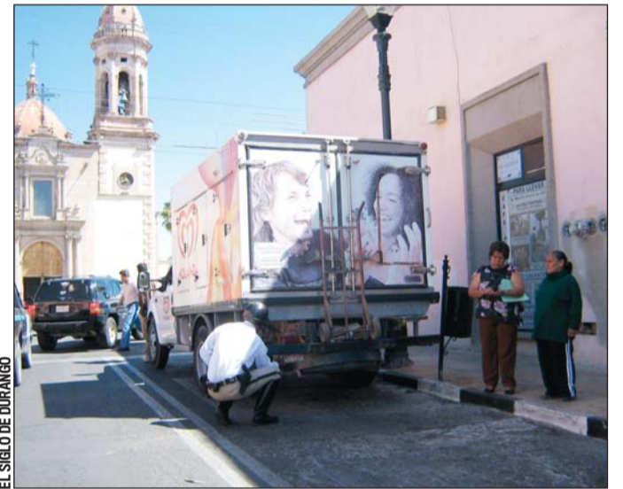
Medidas. También fueron sancionados los conductores que se estacionaron en zonas prohibidas.

Según las autoridades municipales, el principal propósito de aplicar dichas sanciones es prevenir accidentes y generar respeto al reglamento de tránsito de Durango.