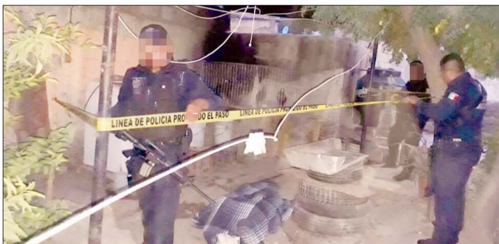
Muertes. La Comarca Lagunera de Durango registra importante aumento de suicidios. Muchos son protagonizados por jóvenes.

Al día siguiente, el martes 11, una mujer de 53