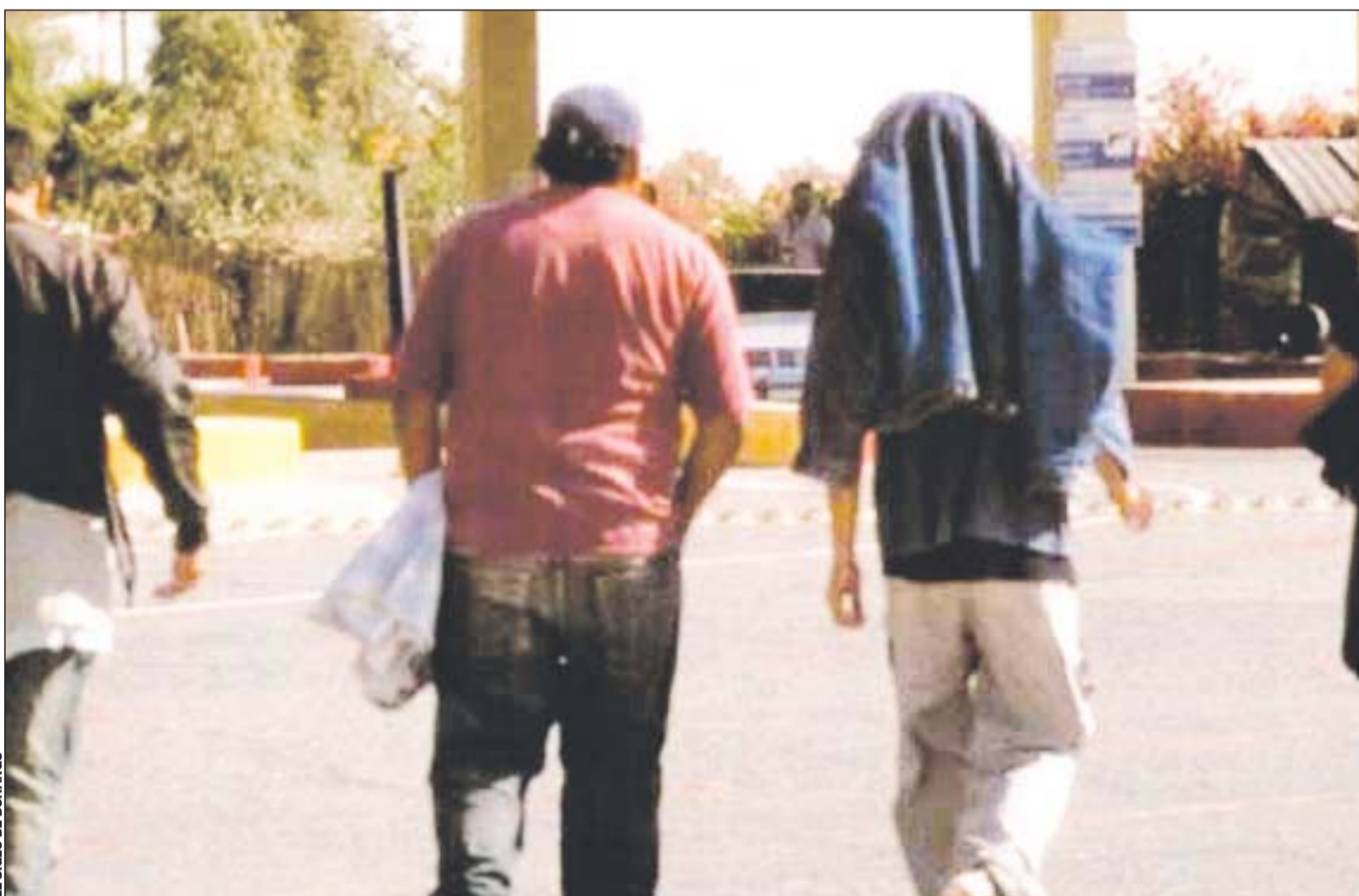
Peligro. Las estafas también forman parte de los riesgos que corre un migrante que busca llegar a Estados Unidos.

1 FOCO donde los migrantes son detectados es en la Comarca Lagunera.