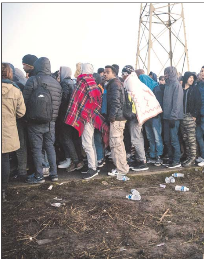
Indocumentados. Principalmente son de procedencia guatemalteca, hondureña y salvadoreña.