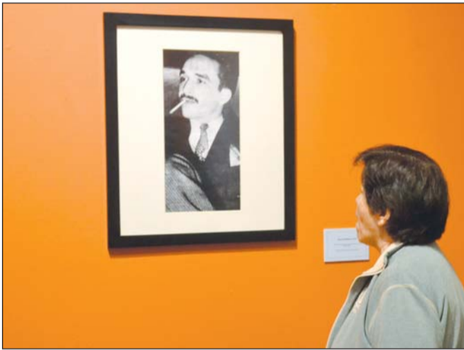
Visual. La mayoría de los elementos de la exposición son fotografías que muestran diversas facetas de 'Gabo'.

El material en conjunto, invita a conocer los aspectos políticos, culturales y personales que llevaron a García Márquez a convertirse en un referente de la literatura universal.