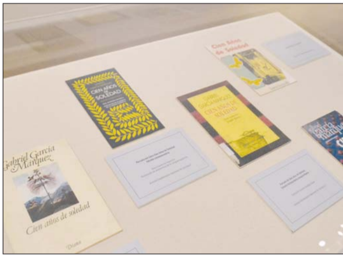
Festejo. Se muestran distintas portadas de su obra 'Cien años de soledad' que este 2017 celebra 50 años de su publicación.