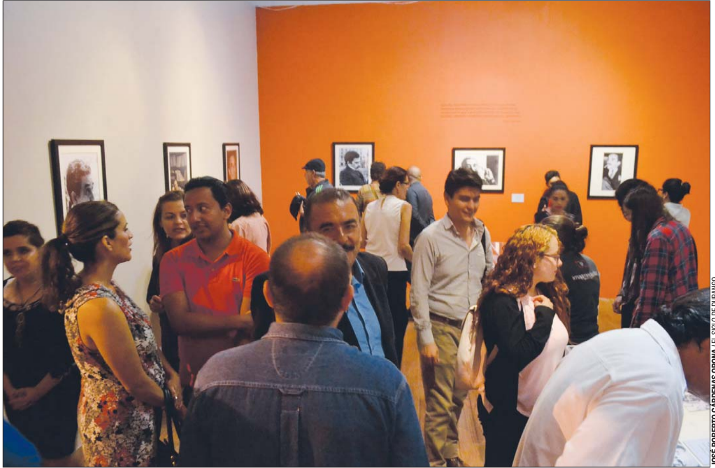
En exhibición. La exposición recopila 54 obras gráficas entre fotografías, recortes de periódicos y portadas de libros.

En las secciones los visitantes encontraron pasajes de la vida del escritor, textos