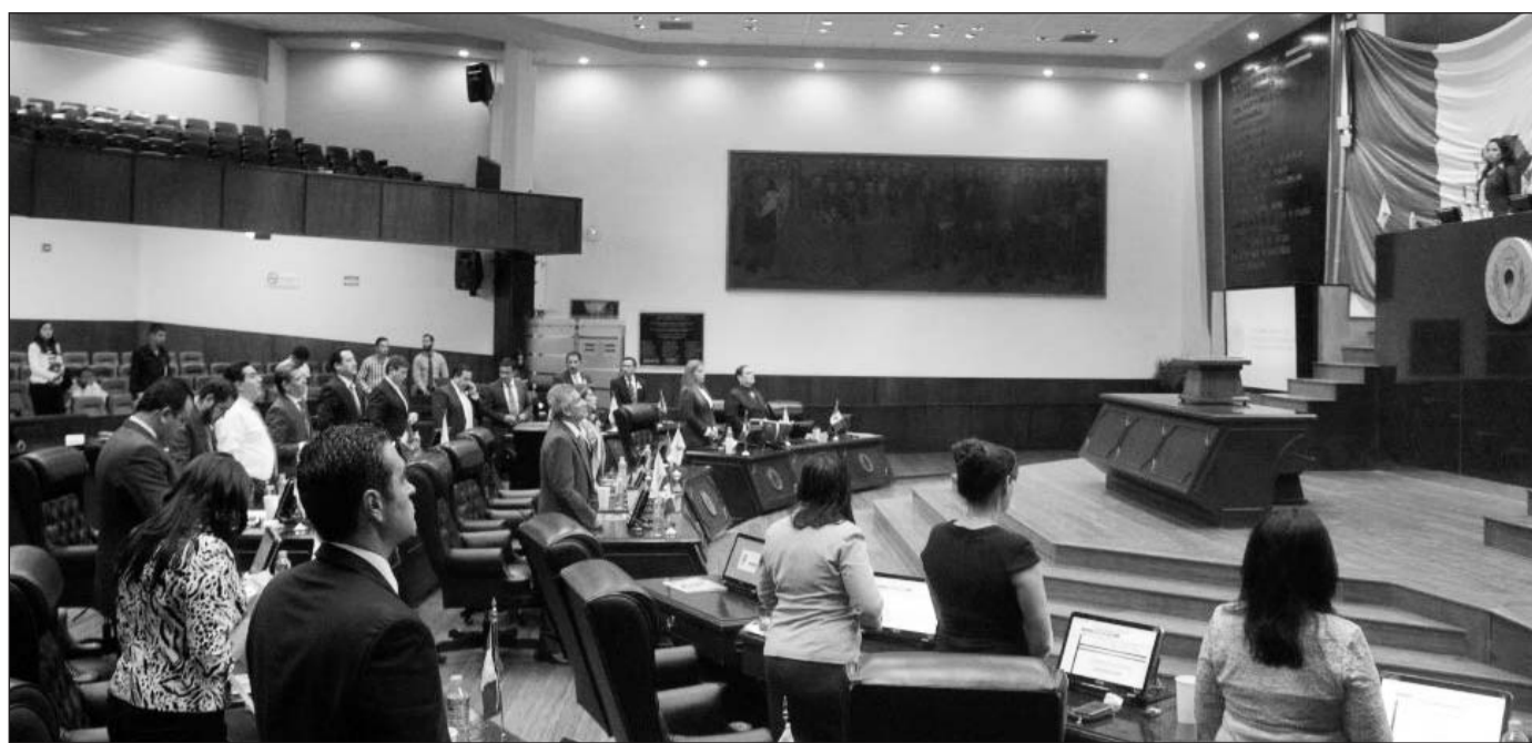
Condiciones. Deberá estar integrado por personal nuevo, alejado de "vicios" de otras corporaciones.