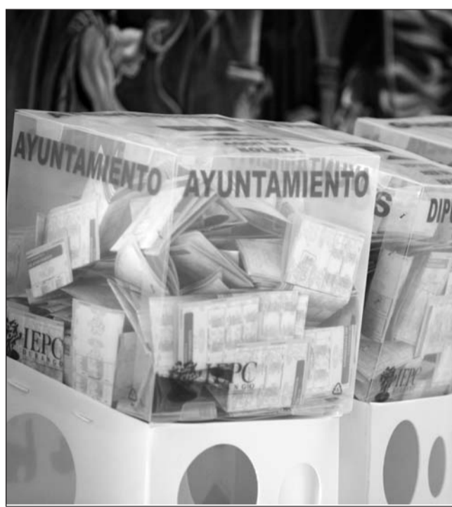
Alcance. Se pretende que hombres y mujeres tengan las mismas oportunidades en el ámbito electoral.

"Consideramos que la paridad es mucho más que hablar de equilibrio perfecto, implica debatir, de manera transversal, la distribución de roles, tareas, oportunidades y poder que ocurre en todos los ámbitos de la vida social. La paridad cuestiona la división sexual del trabajo, según la cual la mayoría de las mujeres está a cargo de las labores del cuidado y de lo doméstico".