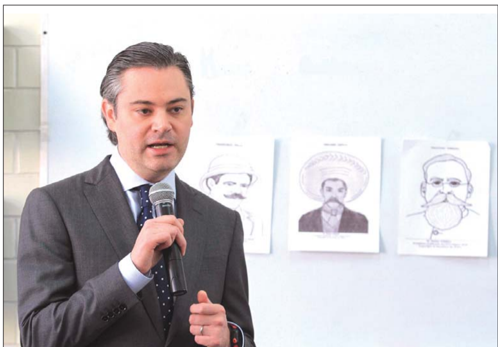
Labores. De las poco más de 44 mil plazas irregulares, 14 mil 900 eran ocupadas por maestros, pero que estaban realizando funciones administrativas, mismos que ya han regresado a las aulas.