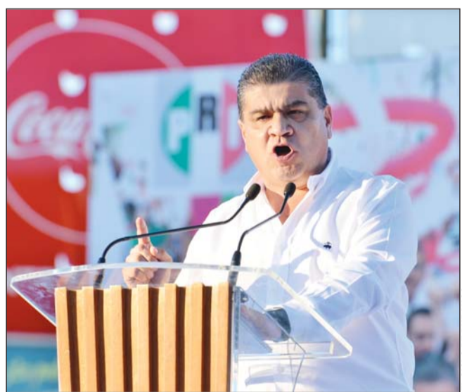
Gastos. El PRI confía en que la mayor parte de las decisiones serán corregidas por el Tribunal.

VERSAL la votación de cada criterio sumó o redujo gastos a los contendientes.