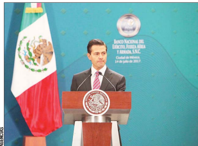
Técnica. Los "soldados cibernéticos" se usan en México para hostigar a trabajadores de los medios de comunicación.

Entre los países que utilizan este tipo de herramientas de manipulación destacan Argentina, Azerbaiyán, Australia, Baréin, Brasil, China, Ecuador, Estados Unidos de América, India, Irán, Israel, México, Corea, Filipinas, Polonia, Rusia, Arabia Saudita, Serbia, Corea del Sur, Siria, Taiwán, Turquía, Ucrania, el Reino Unido, los Estados Unidos, Venezuela y Vietnam.