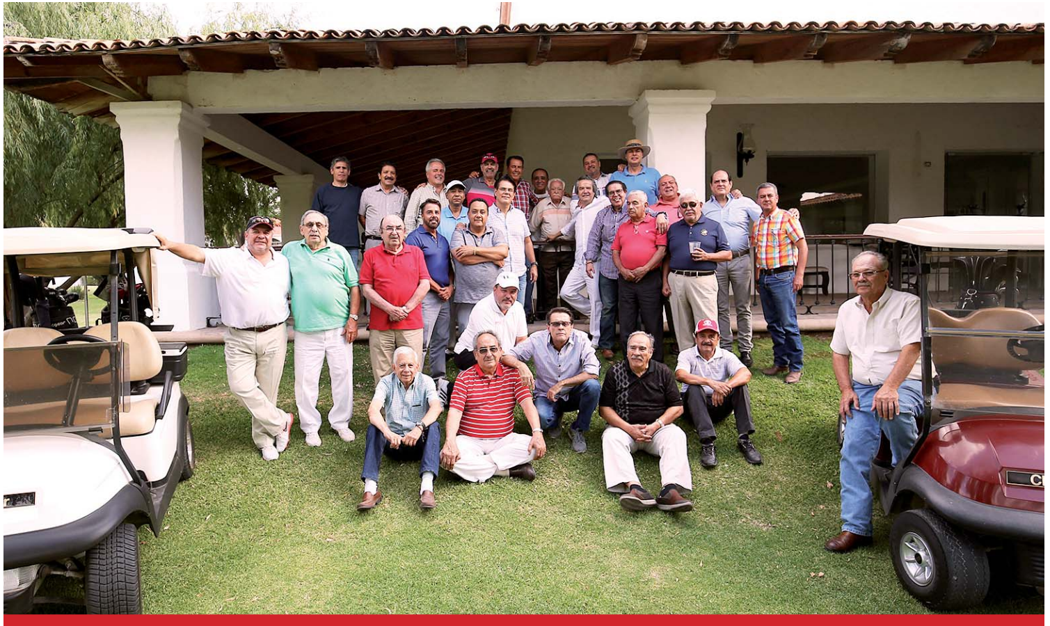
Cada miércoles disfrutan la pasión del golf y la alegría de convivir entre grandes amigos.

Desde aquellos años, las reuniones siguen estando llenas de risas, bromas e historias vividas en el campo de golf, lo que ha servido como imán para que aquél grupo de ocho amigos ahora esté más nutrido al contar con más de 50 apasionados del "deporte de los negocios".