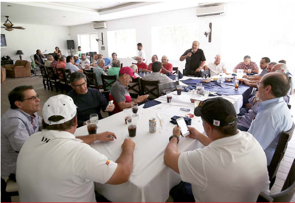
Emotivas comidas se celebran con los golfistas del Club Campestre de Durango.