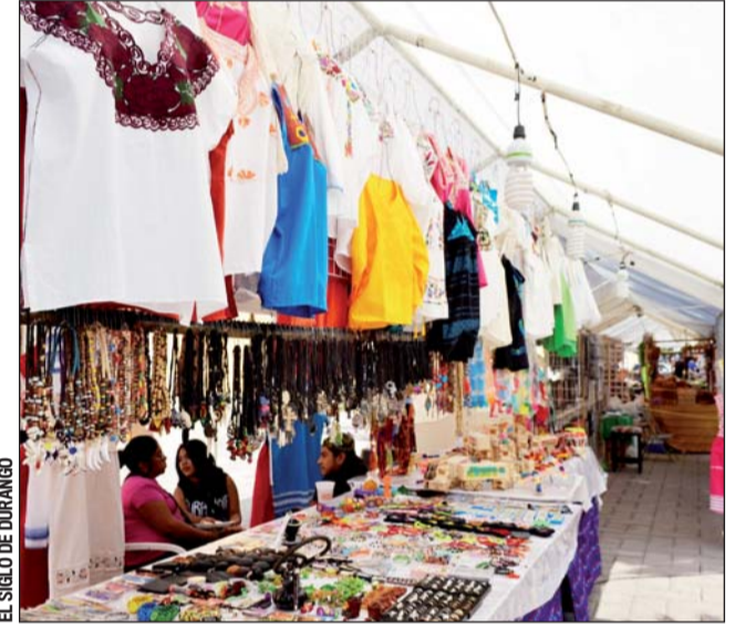
Conflicto. Los artesanos insisten en seguir en el Corredor Constitución, aunque ya se acercaron al Municipio para dialogar.

El diálogo sigue abierto con los comerciantes para llegar a acuerdos que permitan su regularización y mantener la buena imagen del Corredor; por ello, asistirán las Comisiones de Actividades Económicas, Turismo y Cultura, así como la Secretaría del Ayuntamiento para atender sus peticiones.