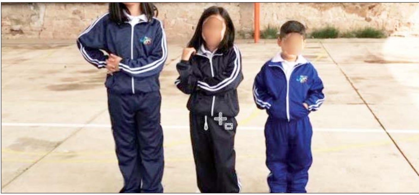
Fabricación. Los uniformes deben estar listos para iniciar la distribución el próximo 20 de agosto que es el primer día del ciclo escolar 2018-2019.