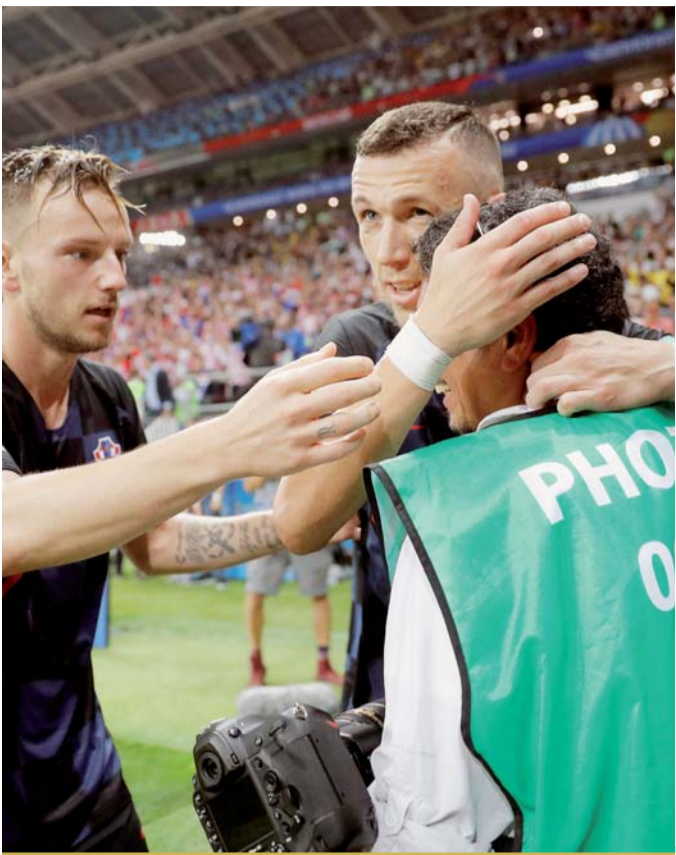
Festejo. El centrocampista croata Ivan Rakitic (i) y el delantero Ivan Perisic (c) celebran con un fotógrafo.

Los goles fueron celebrados con bengalas, petardos, banderas y cánticos.