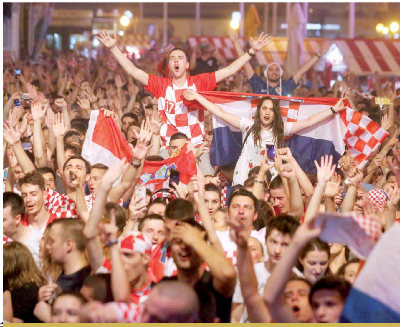
Logro. Croacia festeja su histórico triunfo y mayor logro en el fútbol.

También en este caso la FIFA había pedido previamente a la AUF que no se siguiera con dichas prácticas. Precisa que en el partido contra Francia, de cuartos de final, solamente un miembro de la selección volvió a exhibir marcas comerciales no autorizadas en los equipos de juego.