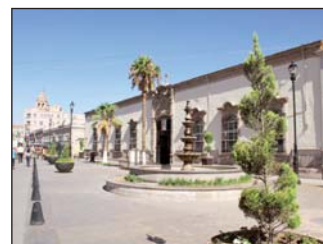
Se capacitan de manera constante.

La Dimensión de Misiones de la Arquidiócesis de Durango invita a todos los agentes de pastoral, ministros de la Eucaristía, catequistas, religiosos, formadores de la vida consagrada, visitadores de enfermos, integrantes de grupos de apostolado, grupos de la liga misionera y grupos juveniles, a que sean participantes del curso arquidiocesano de animación y espiritualidad misionera, que se llevará a cabo del 13 de julio al 11 de agosto, en el Seminario Laical, ubicado en calle Zarco #311 de la zona centro de la ciudad capital.