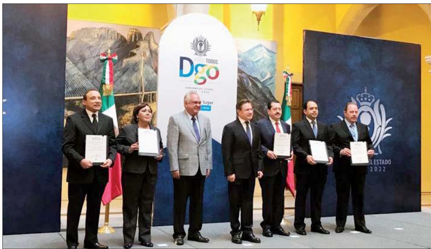
Objetivo. A decir del gobernador, los cambios obedecen a la necesidad de fortalecer las acciones para resolver la demanda ciudadana.