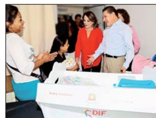
Se busca propiciar mayor seguridad a los menores.

Mediante el Programa “Cuna, mi primer abrazo”, que opera la Dirección de Atención al Desarrollo Familiar y Humano del Sistema DIF Estatal se apoya a las mamás que se encuentran en estado de vulnerabilidad con una cuna equipada y diversos accesorios para el cuidado y atención de los bebés durante sus primeros meses de vida. El 80 por ciento de los nacimientos del estado se registran en el Hospital Materno Infantil, por lo que las mamás beneficiadas de este programa provienen de todos los municipios de la entidad, se informó.