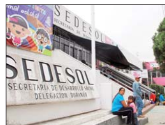
Se les hará el depósito a través de tarjeta.