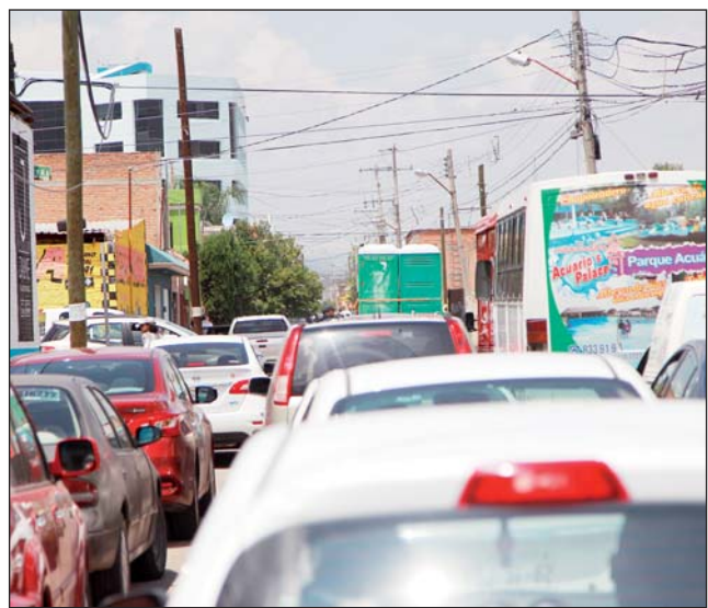
Trabajos. La circulación será más fluida ya que terminarán los trabajos.

Esto tomando en cuenta las demandas de los grupos ambientalistas, quienes pidieron que no se quitaran árboles para evitar afectación.