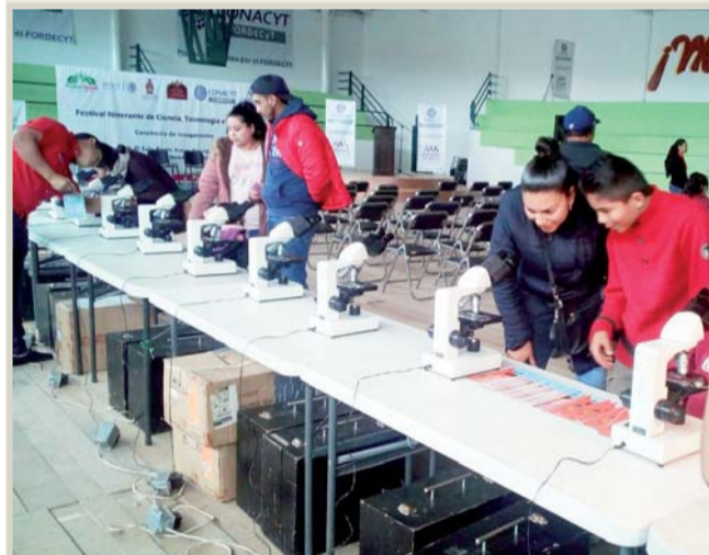
Atención. La exposición captó el interés de los asistentes.