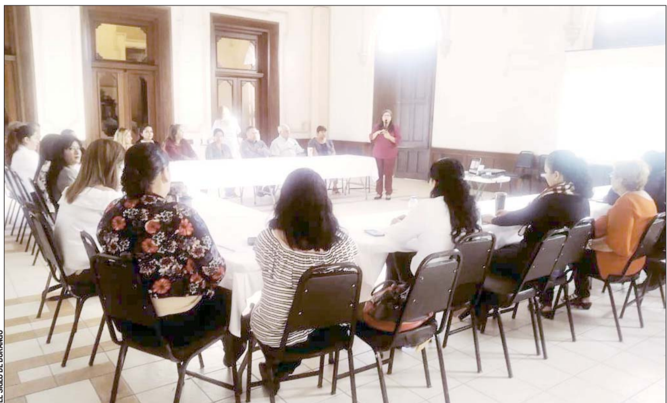
Evento. Mujeres de diferentes dependencias participan en una mesa de trabajo donde se destacó la equidad de género.

En virtud de que dicho deporte continúa manteniendo el auge que lo ha caracterizado desde hace varias décadas, el entrenador precisó que es importante que los pequeños lo practiquen con cierta frecuencia, de ahí que se les han fijado tres días por semana, con lo que se busca sentar las bases de lo que será en un futuro cercano una camada de jugadores sobresalientes.