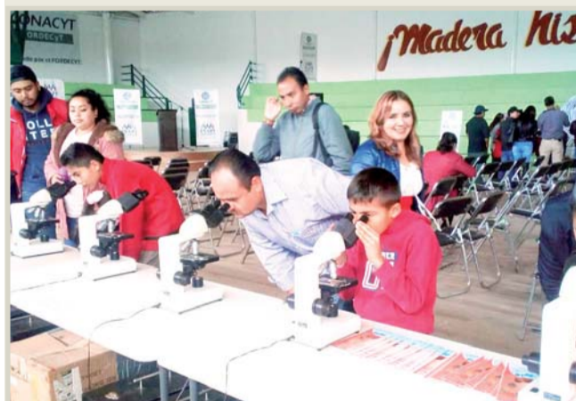
Objetivo. Buscan divulgar la importancia de la ciencia.