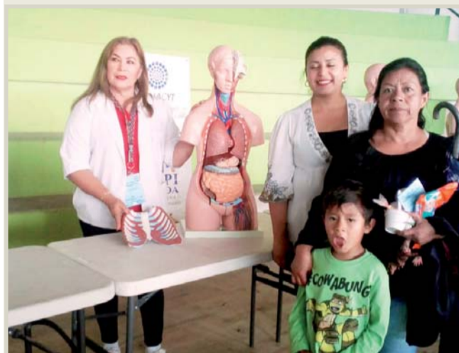
Afluencia. Madre e hijos acudieron al evento.

La titular del Cocyted indicó que el referido programa permanecerá una semana en esta demarcación, donde el equipo de Sinaloa aporta una exposición itinerante que capta la atención de los niños.