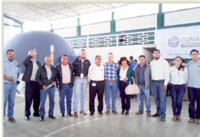
Presencia. Autoridades encabezaron el evento.