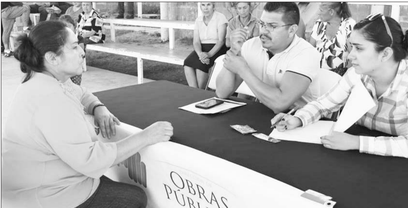
EL SIGLO DE DURANGO

No sin sobresaltos, el programa ha logrado ofrecer comida caliente, balanceada y accesible a un buen número de ciudadanos, entre los que destacan los estudiantes de educación básica, mujeres embarazadas y sobre todo adultos mayores.