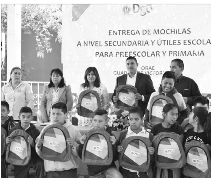
EL SIGLO DE DURANGO

Una de las formas más eficientes de prevención tiene que ver con el hecho de que la ciudadanía se involucre. No solo se trata de que participe de manera activa en los planes y programas enfocados a mejorar la calidad de vida, sino que también los entienda.