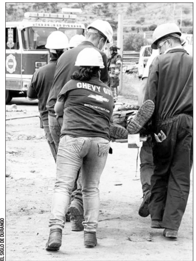
EL SIGLO DE DURANGO

Avance. La instalación de empresas genera más empleo y mejor flujo de efectivo.