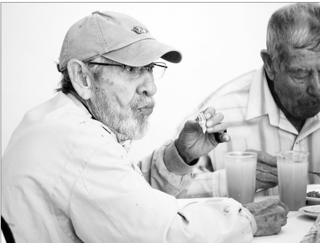
EL SIGLO DE DURANGO