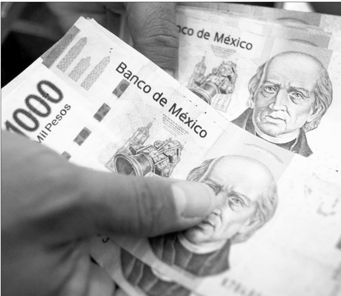
Comparación. De acuerdo con un estudio realizado por el IMCO, si en los últimos años los estados hubieran ejercido lo que presupuestaron para gasto burocrático se habrían aborreado 226 mil 577 millones de pesos.