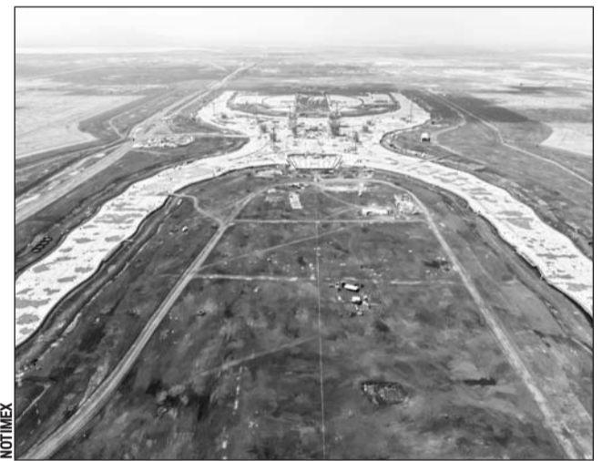
Decisión. Consulta que decidirá futuro de aeropuerto de Ciudad de México durará 4 días, informó López Obrador.

La consulta en la que se decidirá si continúan o no las obras del NAIM se efectuará a lo largo de cuatro días, y no de uno como estaba previsto, informó ayer el futuro Gobierno de Andrés Manuel López Obrador.