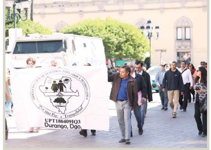
El jueves, maestros del Sindicato de Telesecundarias se sumaron a la movilización de la CNTE.