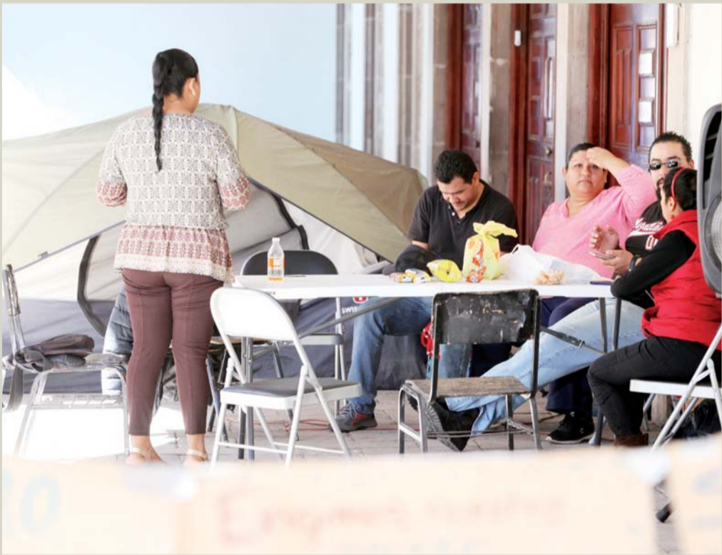
Los maestros que reclaman sus pagos por más de dos años de trabajo, montaron un campamento en el que permanecen de día y de noche.