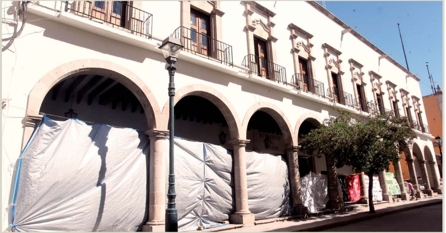
El exterior del Congreso está tomado por los manifestantes, justo en uno de los dos momentos del año en que más visitantes foráneos tiene la ciudad capital: el Festival Revueltas.