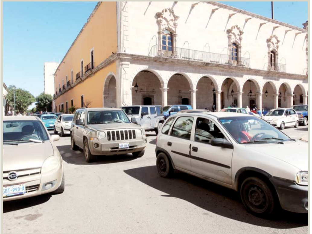
En Zaragoza y 5 de Febrero, el caos llega de manera constante desde el día que inició el cierre de calles.