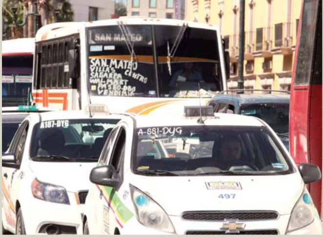
El intenso tránsito provoca retrasos en el traslado a través de varias calles aledañas.