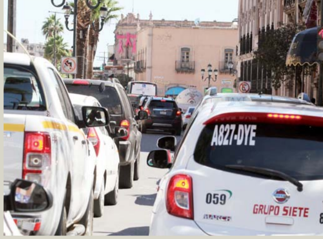
El solo cierre de una esquina, impacta varias cuadras a la redonda