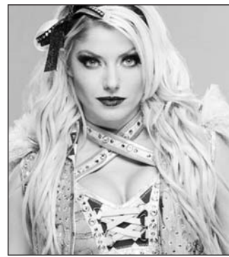
Alexa Bliss no se rinde y quiere un gran regreso.

Por el momento Alexa fue nombrada como encargada de la División Femenil de RAW, por lo que de momento definirá lo que suceda con las mujeres de la marca roja en lo que puede regresar a la actividad.