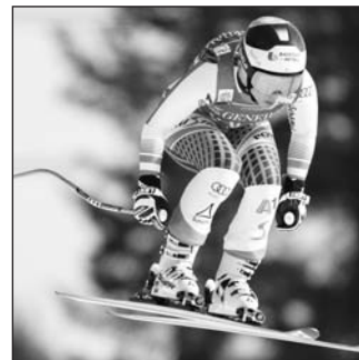
Nicole Schmidhofer demuestra su talento.

Schmidhofer, de 29 años y campeona del mundo de descenso en Sankt Moritz en 2017, aunque hasta esta temporada contaba con sólo cuatro podios en su historial en el circuito, estrenó el viernes su palmarés de victorias y este sábado sumó su segundo triunfo al marcar un tiempo de 1:47.68. La acompañaron en el podio su compatriota Cornelia Hütter, segunda a 44 centésimas, y la suiza Michelle Gisin, tercera a 47.