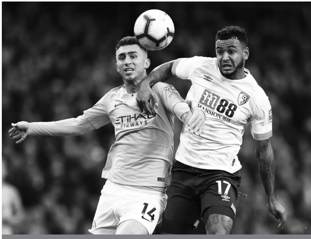
Fuerza. Manchester City sigue con paso triunfal y de líder en Liga Premier.

El United, sin embargo, agudizó su depresión. El cuadro de Jose Mourinho, sin embargo, evitó la derro-