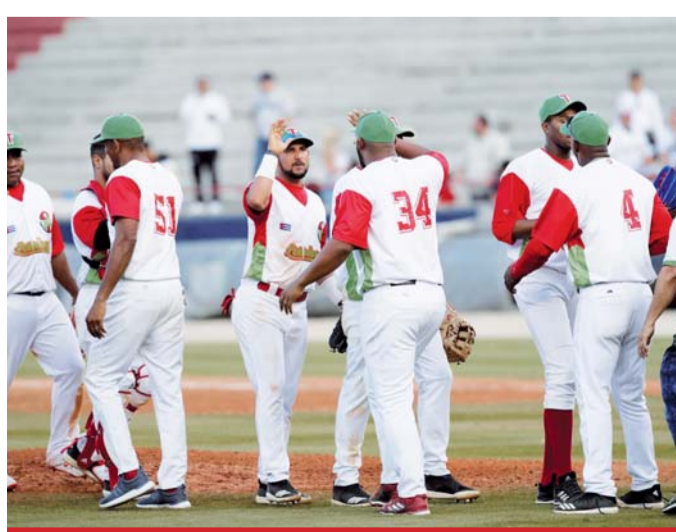
Panamá disputará frente a los Leñadores de las Tunas (Cuba) la final de la versión número 61 de la Serie del Caribe, que se realiza en el estadio Rod Carew, en la capital panameña.