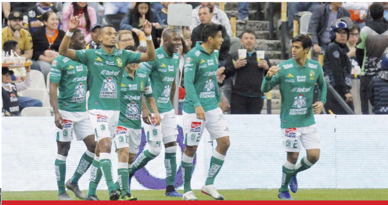
Triunfo. El club de fútbol León propinó una dolorosa derrota de 3-0 en calidad de visitante al campeón América.