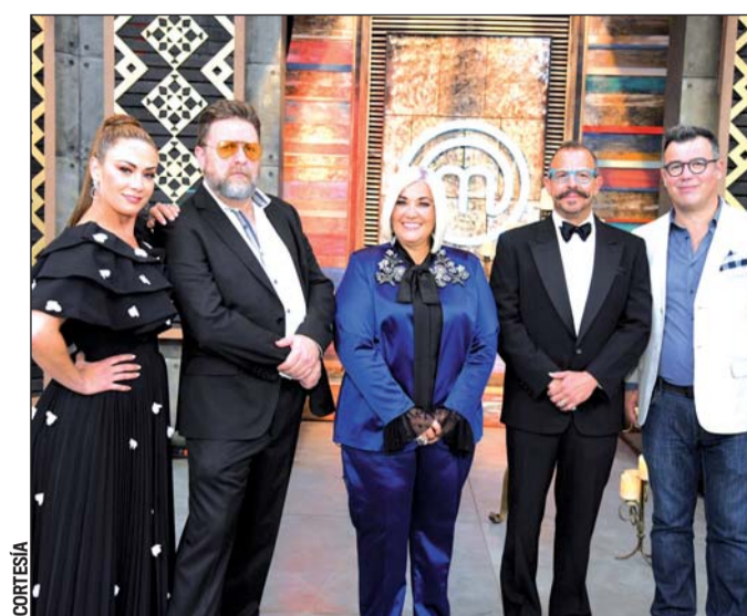
Decisión. A lo largo de dos horas descubre quién de los tres finalistas se convertirá en el ganador absoluto.

Precisamente esta última película es la más nominada, 12 categorías, 'ROMA' se encuentra en seis y 'Blackklansman', en cinco.