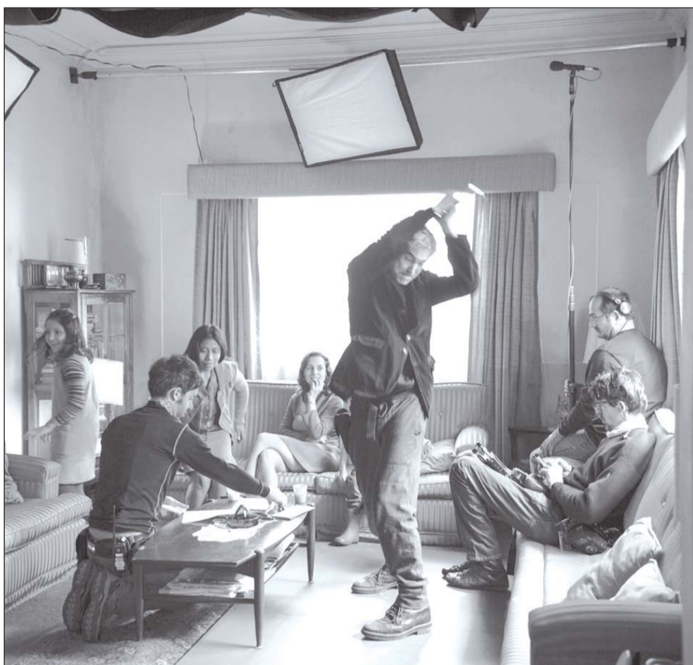
Especial. La ceremonia de los premios BAFTA se realizará en el londinense Royal Albert Hall. Es la última premiación de cintas previa al Oscar.

La favorita logró el Globo de Oro a Mejor actriz (Olivia Colman) y Nace una estrella ha estado nominado