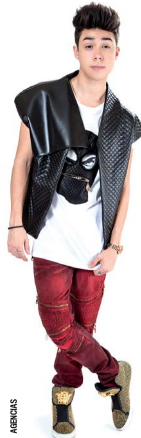
Nueva faceta. Alternó a su carrera musical, Bautista incursiona por primera vez en el doblaje.

Es así que emprende un viaje con alguno de sus amigos y llegan a una academia donde estudian y se preparan los seres humanos perfectos; sin embargo, se enfrentarán a 'Lou', un chico egocéntrico que dirige el instituto y no les permite realizar su sueño de ser como los demás.