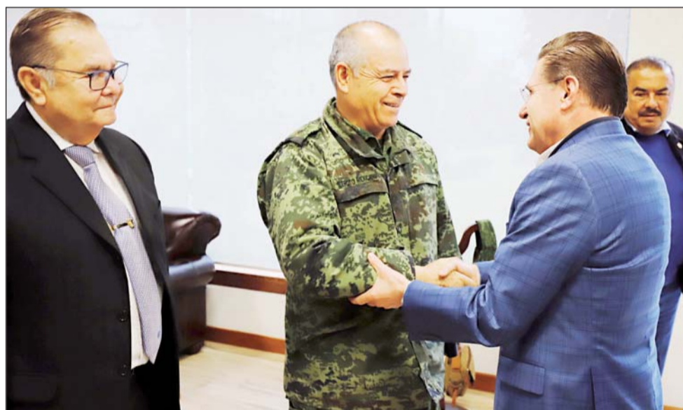
De enero de 2018 a enero de 2019, hay una disminución del 18.63 por ciento.

En este periodo el número de denuncias pasó de 2 mil 838 en 2018 a 2 mil 309 en 2019, y en los municipios de Durango, Gómez Palacio y Lerdo, se concentró el ma-