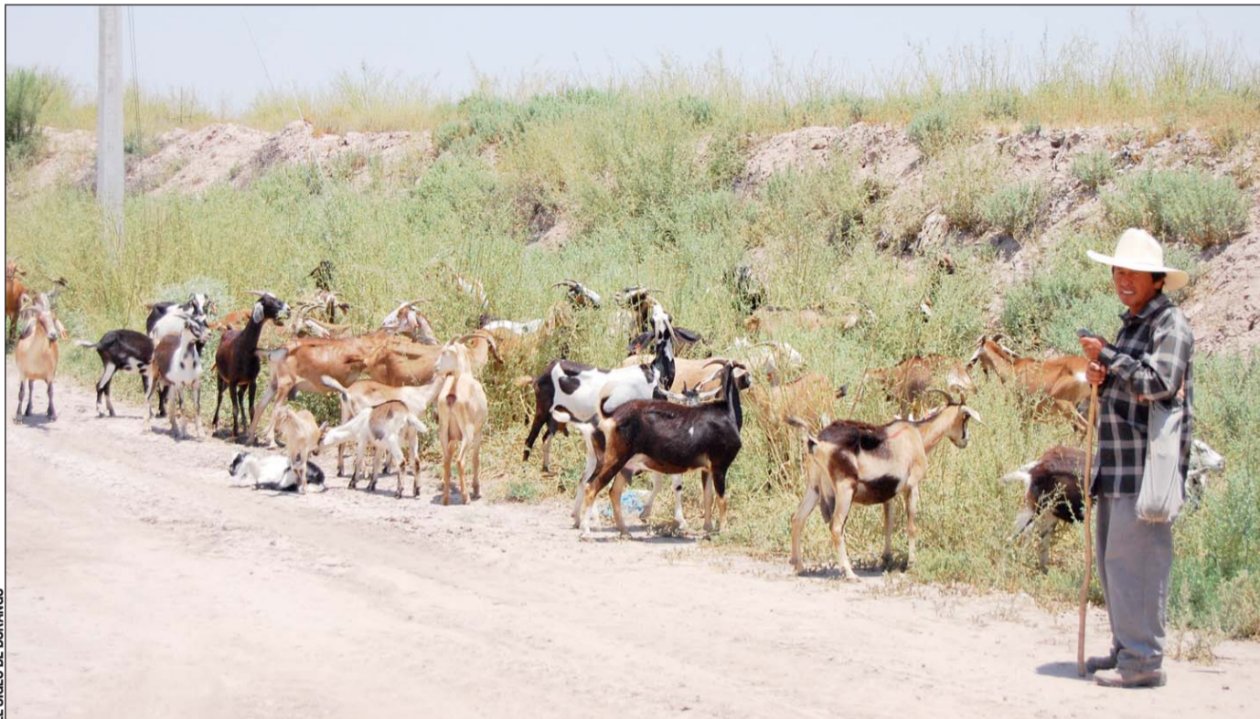
Reporte. Informes estadísticos revelan que entre Coahuila y Durango, aportaron el 43 por ciento de la producción total de leche de cabra del país en 2018.

En tercer lugar se ubica Durango, en donde la producción de leche de cabra durante el año pasado fue de 25 mil 688 miles de litros.