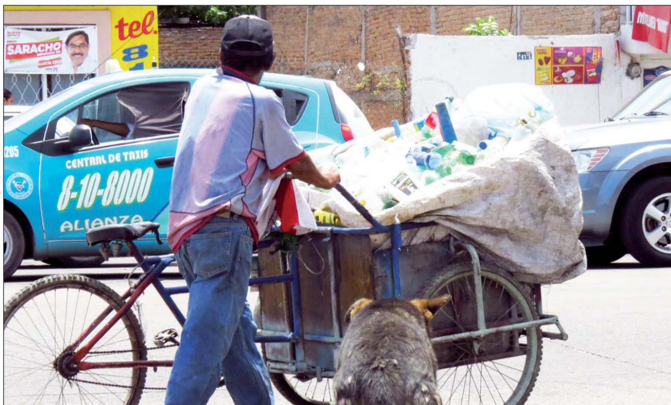
EL SIGLO DE DURANGO

De esta forma, se puede apreciar cómo algunas personas recorren generalmente las zonas urbanas, entre colonias y fraccionamientos, ya que es ahí donde se genera la mayor cantidad de residuos de ese tipo por lo que se acumulan todos los días, aunque también hay quienes se deshacen de ellos tirándolos al piso o revolviéndolos con los demás desechos sólidos.