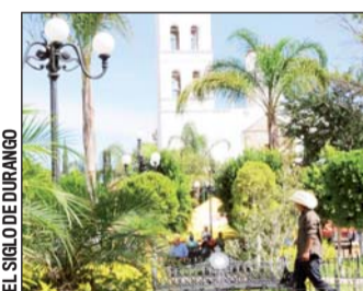
EL SIGLO DE DURANGO Clima. En el municipio de Mezquital, el mercurio marca 12 grados por la mañana.

De 6.5 grados bajo cero fue la temperatura mínima este domingo en La Rosilla, municipio de Guanaceví.