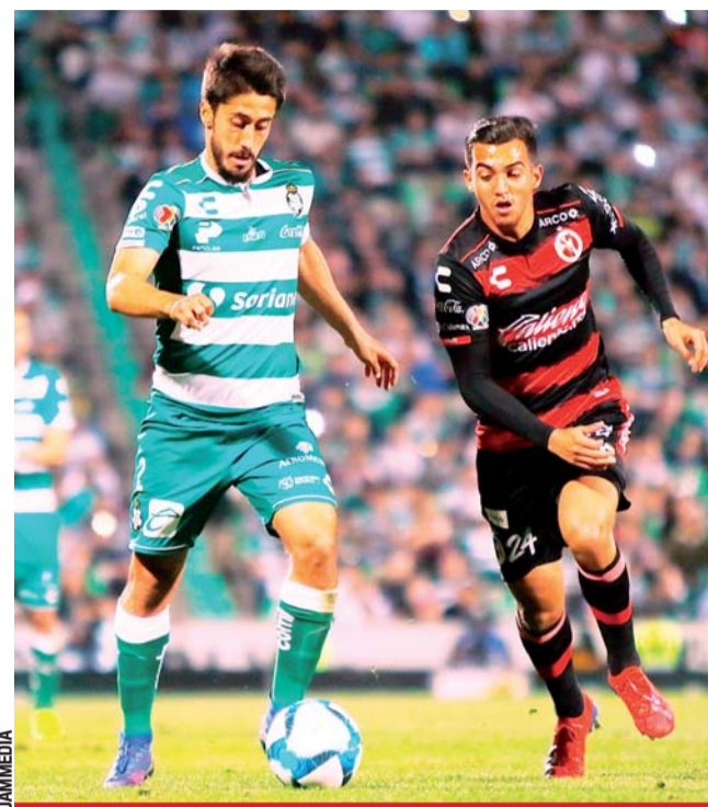
Igualada. Sin hacer pesar su feudo, Santos Laguna sumó su segundo partido sin ganar, al empatar 1-1 con Xolos de Tijuana.