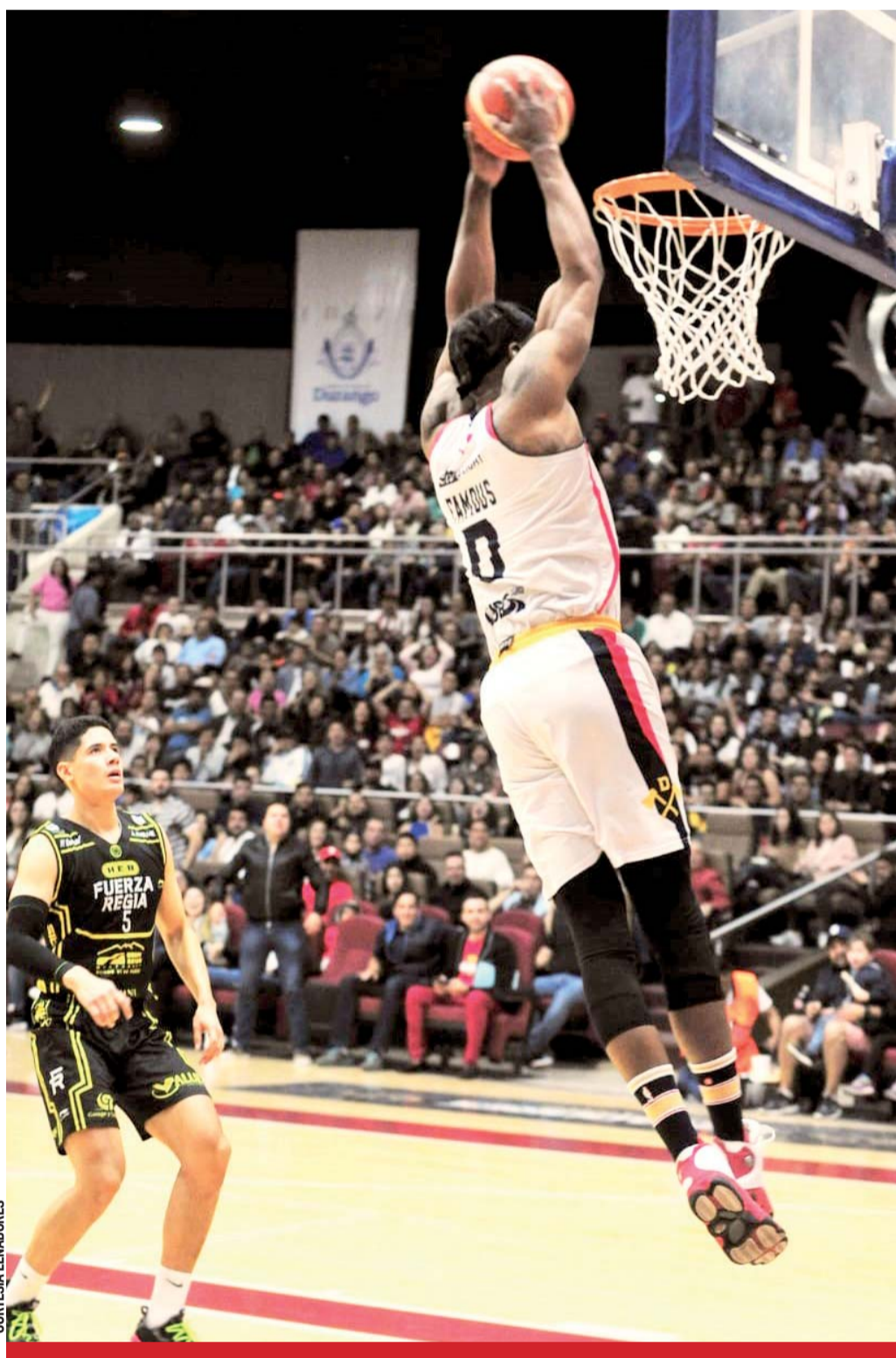
Pasión. El Auditorio del Pueblo vibró con la victoria de Leñadores sobre Fuerza Regia.