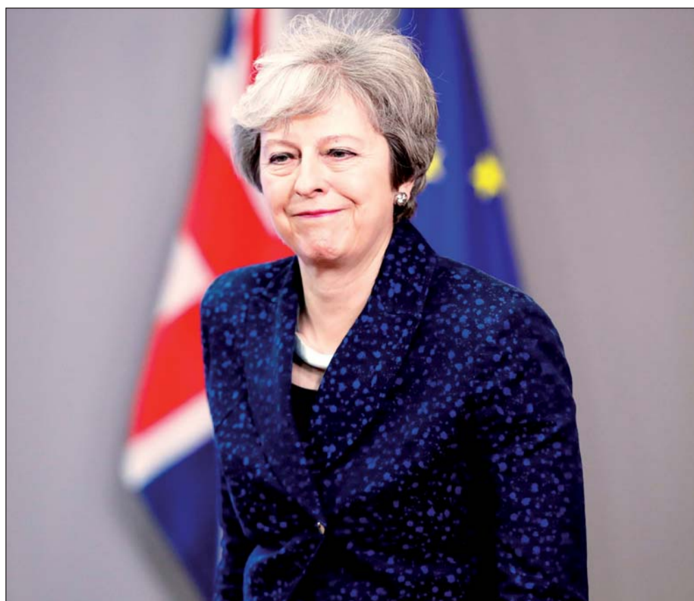
Equilibrio. La decisión de ofrecer esta nueva votación respondería, según la prensa, a que May quiere tranquilizar a los miembros de su Gobierno que amenazan con dimitir.