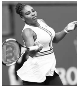
Serena Williams de nueva cuenta frena su regreso.

La ganadora de 23 títulos de Grand Slam, que derrotó en la ronda anterior a la bielorrusa Victoria Azarenka en un intenso partido por 7-5 y 6-3, tuvo que abandonar contra la española Garbiñe Muguruza, actualmente vigésima en el ranking WTA, por problemas de respiración en el segundo set. “Antes del partido no me sentía bien, luego empeoraba con cada segundo; mareo y fatiga extrema”.