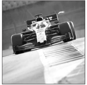
Motivación para una mejor competencia.

También se concederá un punto al constructor del piloto que haya realizado la vuelta rápida. “El Consejo Mundial del Automovilismo de la FIA aprobó este cambio en el Reglamento Deportivo de 2019 en su última reunión celebrada el 7 de marzo en Ginebra, a condición de que el Grupo Estratégico de la F1 y la Comisión de la F1 votaran por correo electrónico. Este proceso ha concluido este lunes y ha sido aprobado por unanimidad”, señala la FIA.