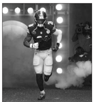
Raiders también pretende a Le'Veon Bell.

Si bien los New York Jets siguen siendo los favoritos para contratar a Le'Veon Bell, una vez que la Agencia Libre abra este miércoles, lo único seguro es que el RB firmará con el equipo que presente la mejor oferta. En caso de que los Raiders logren incorporar a Bell, serían dos los ex jugadores de Steelers que lideren una franquicia, que en 2020 se mudará a Las Vegas.