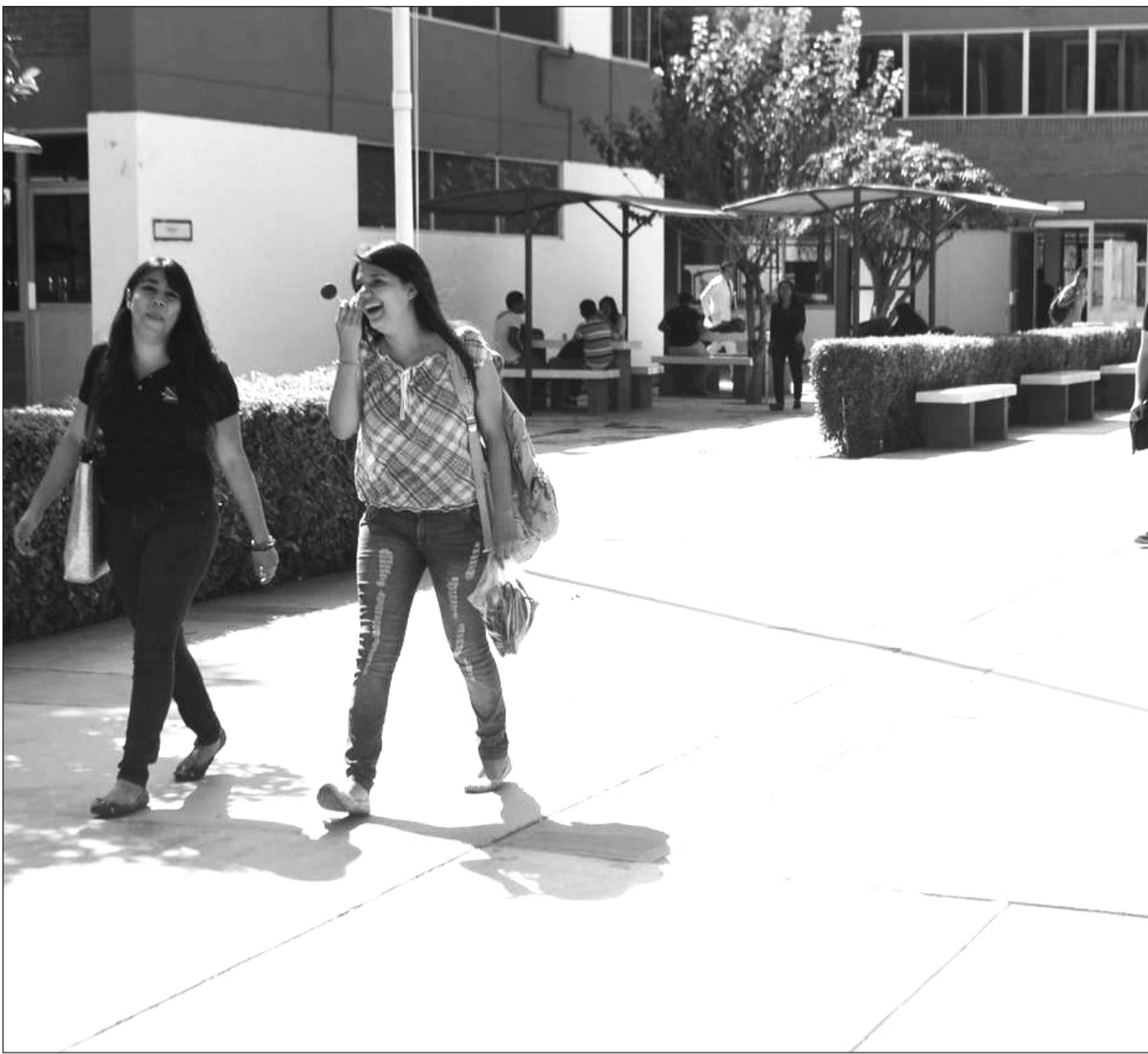
Rezago. No es fácil para los jóvenes mexicanos acceder a un posgrado ya que implica un costo considerable. Sería un gran beneficio que se extendiera la gratuidad en este nivel, pero con un recurso contemplado para que las universidades puedan seguir ofreciéndolos.