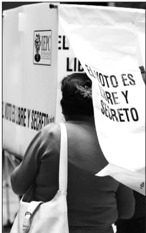
Aún falta. Todavía quedan algunos partidos por definir a sus candidatas, pero los hombres figuran.

Sin embargo, los partidos políticos privilegian en los municipios de mayor población, como es el