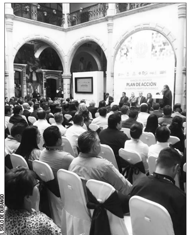
Lento. Desde 2017 se trabaja en un plan de Gobierno Abierto pero apenas se publicarán los resultados del primer programa.

Los gobiernos deben contemplar programas integrales para atender a los adultos mayores tomando en cuenta que en los próximos años se irá incrementando este sector de la población hasta que finalmente sea mayoría. Y es que, no sólo padecen dificultades por cuestiones económicas sino también por aspectos relacionados con su salud ya que son pocos los especialistas para atenderlos.