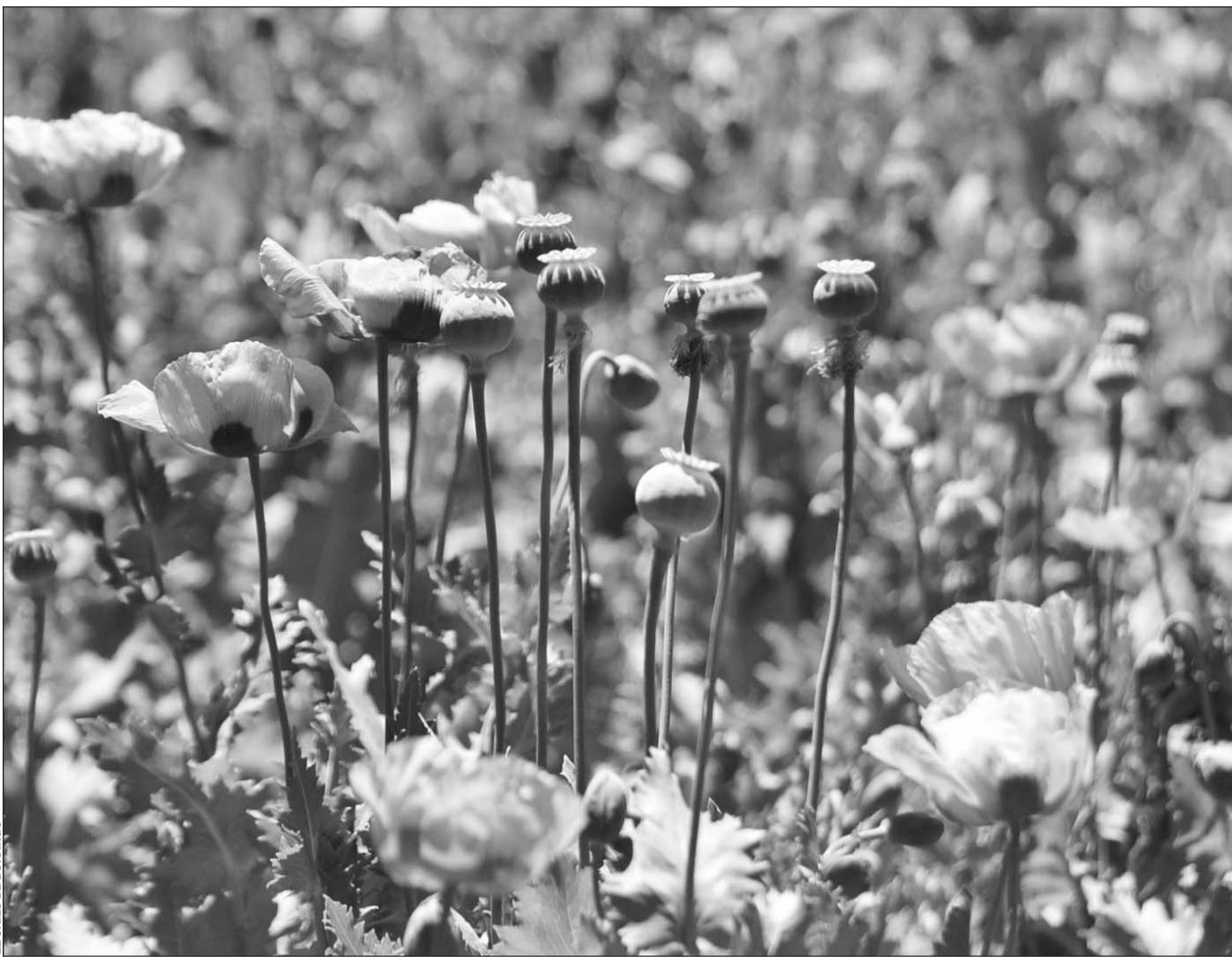
Condición. El Gobernador del Estado consideró que a Durango le iría bien con el aprovechamiento de la amapola y maribuna para fines medicinales.