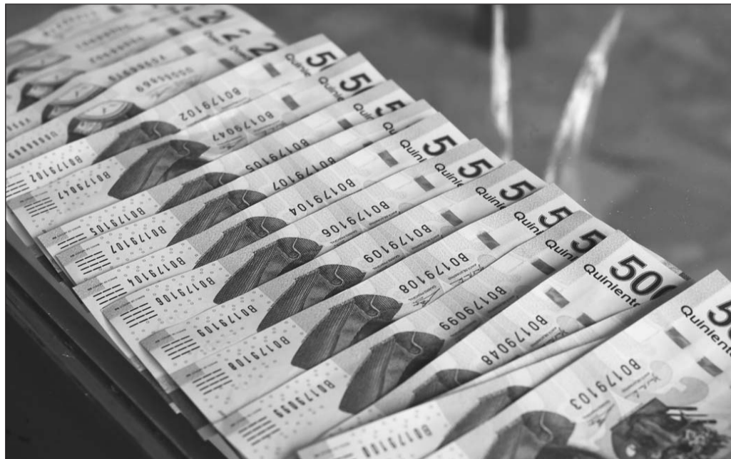
Pendiente. No se han contemplado medidas para evitar que los recursos que son observados se queden sin solventar.

En este sentido, expuso que al ser las cuentas públicas del término de las administraciones municipales, los alcaldes “deben haber hecho bien su trabajo” y dejar finanzas sanas.