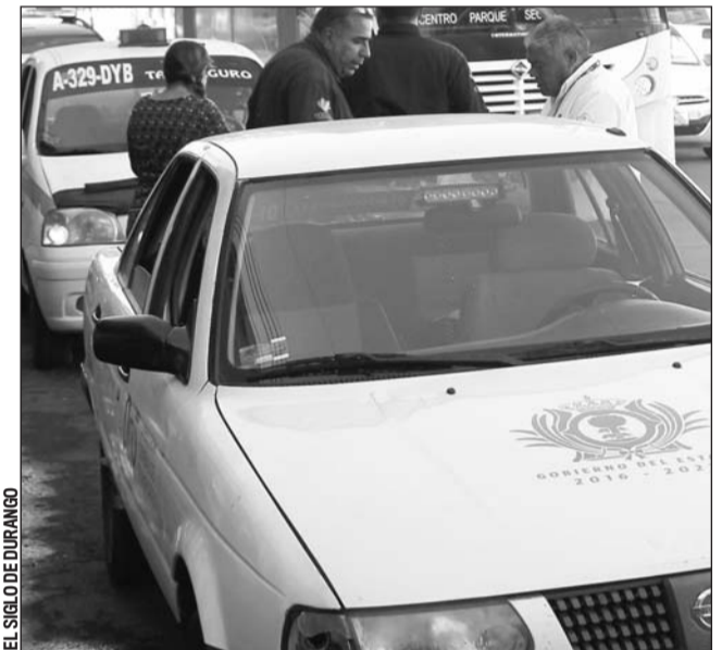
Atención. Hay más de 120 unidades de transporte de personal que se encuentran en proceso de regularización.

Y es que se han dado detectado casos en que, el propietario del vehículo o el operador como responsable de la misma hace caso omiso de reactivar el permiso, razón por la que se procede a la aplicación de la sanción.