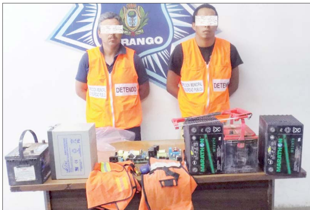
Camuflaje. Usaban chalecos para hacerse pasar por empleados de una empresa de telefonía.

Empleado de empresa telefónica llegó a trabajar y encontró a los ladrones.