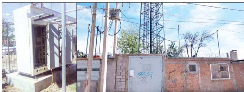
Bienes. Al momento del arresto se les aseguró una camioneta Ford Ranger, en la que ya llevaban algunos objetos de la antena.

Se sospecha que son más los atracos de este tipo los cometidos, por lo que se revisarán antecedentes denunciados ante instancias ministeriales de todo el país y así buscar coincidencias con las huellas dactilares y rasgos de ambos sujetos.