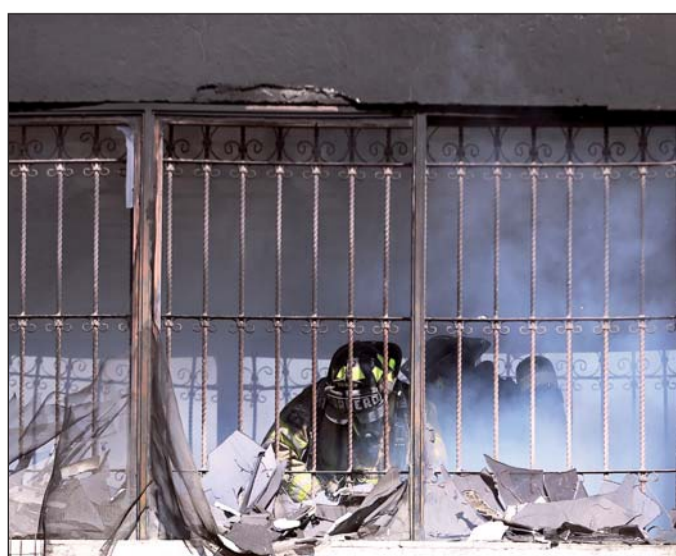
Los bomberos arribaron muy pronto; sin embargo el viento avivó las llamas provocando daños de consideración al inmueble.

Un par de sujetos esperaron a que terminaran las clases en un jardín de niños de la colonia Las Encinas para empezar a desmontar la malla ciclónica que lo rodeaba; sin embargo una vecina que se percató llamó a los policías municipales, que llegaron cuando ya la tenían arriba de un taxi. Ya fueron denunciados penalmente.