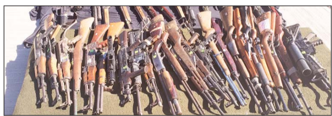
Método. La destrucción se hizo mediante el método de corte; quedaron inutilizables.

Sin embargo es una cantidad menor si se le