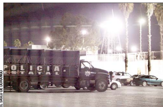
Historia. Esta sentencia condenatoria es una de las más largas impuestas por jueces penales de Durango.