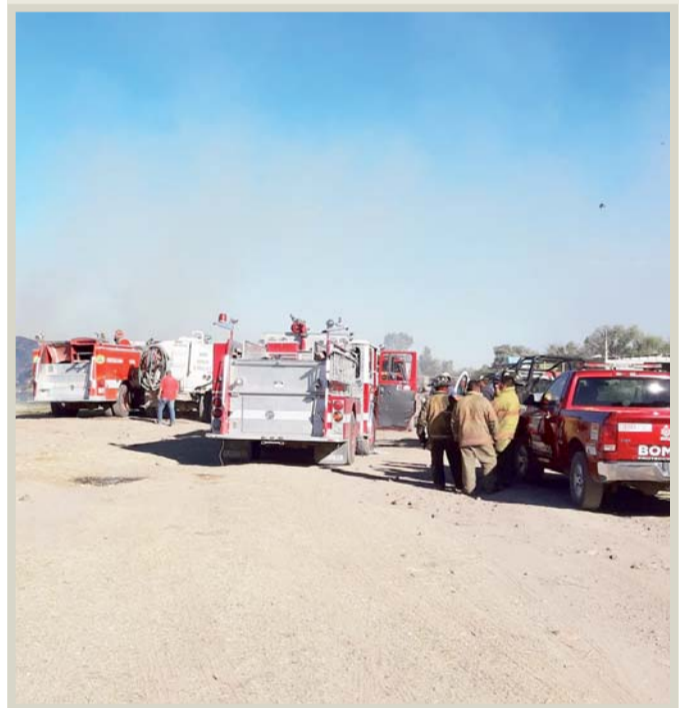
Ayuda. Acudieron a apoyar bomberos de varios municipios.