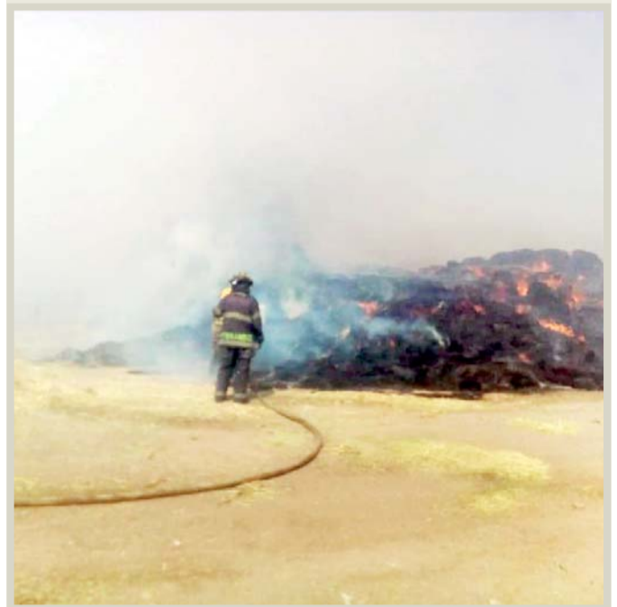
Superficie. El 100% del Basurero se quemó.

De acuerdo con reportes extraoficiales, se indicó que el siniestro fue provocado este miércoles alrededor de las 6:00 horas, según la llamada que se recibió en la Unidad Municipal de Protección Civil.