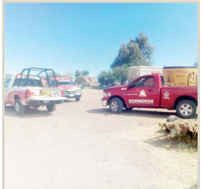
Tiempo. Más de 24 horas duraron las labores de control.