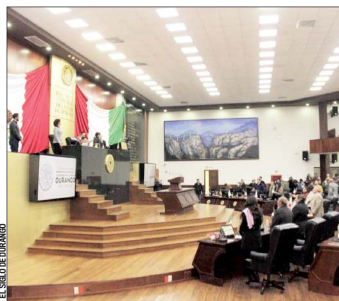
Receso. Durante la próxima semana no habrá actividad en el Congreso del Estado.

En contraste, los legisladores locales llevan menos de ocho meses trabajando pero ya tuvieron vacaciones en diciembre por la temporada decembrina y tendrán otras vacaciones más por la Semana Santa. Pero esto no merma su salario, los diputados ganan 59 mil 353.09 pesos mensuales.