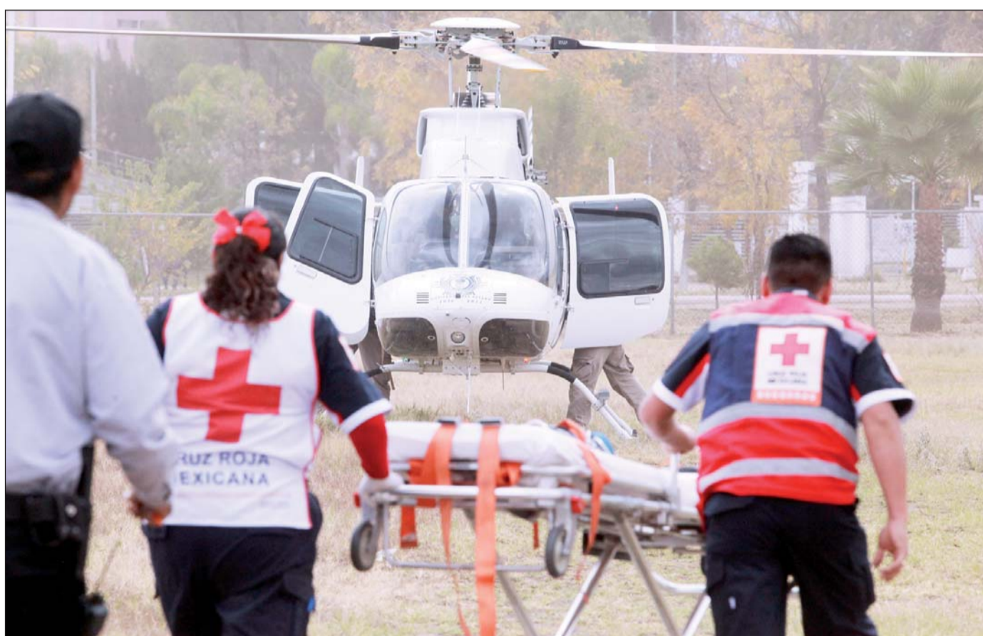
Urgencia. Víctimas de estos arácnidos han llegado desde zonas lejanas a la capital para ser atendidas, la mayoría son niños.

La capital está asentada en el hábitat del arácnido marrón, así que diariamente las familias lidian con él. Las zonas de mayor presencia de alacranes en la ciu-