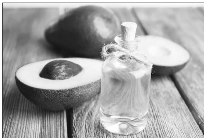
El aceite de aguacate se produce con aguacates maduros, al prensar la pulpa y separar el aceite con centrifugación.

nución de los niveles de colesterol y presión arterial.