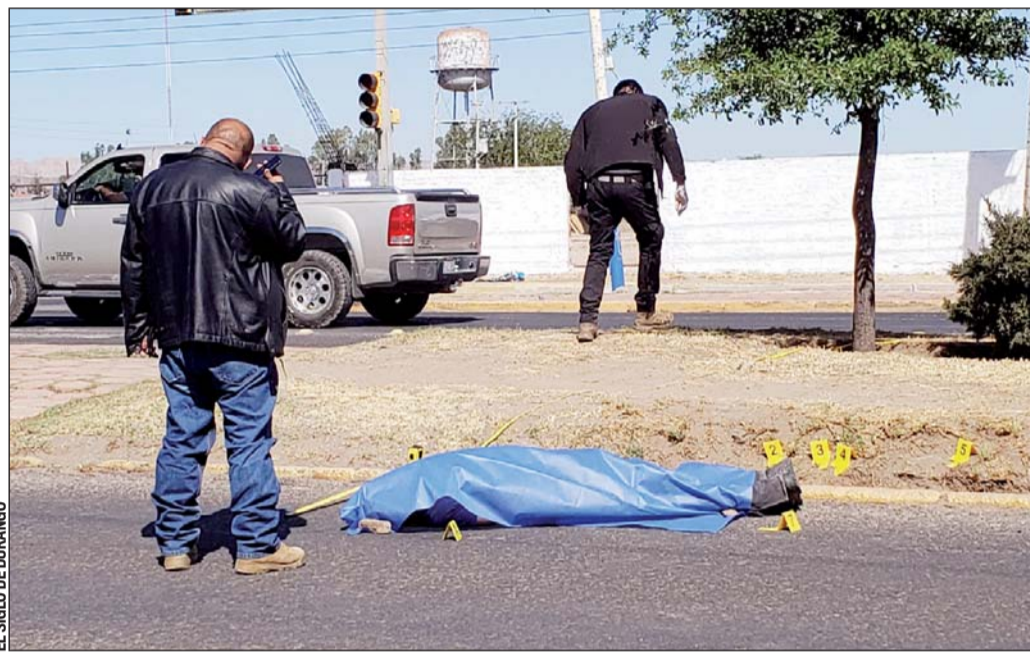
Delitos. Un intento de "levantón" terminó con la vida de un joven de entre 30 y 35 años de edad.

El relato de automovilistas, comerciantes y perso-