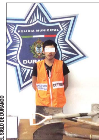
La captura fue realizada por policías municipales.

El sujeto fue puesto a disposición del agente del Ministerio Público.