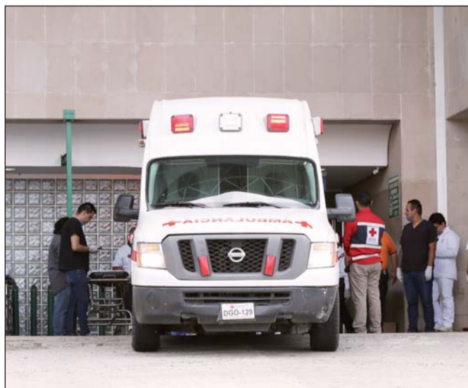
Incidente. La menor murió por causas aún desconocidas.

Sin embargo la inspección física realizada por el personal del IMSS mostró