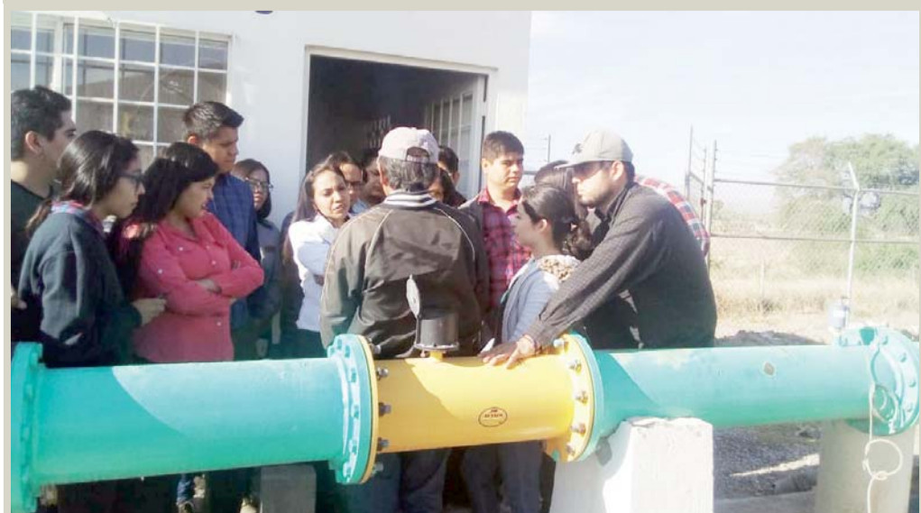
Los jóvenes reciben una explicación amplia sobre el proceso que se realiza para el tratamiento de las aguas residuales que se generan en las viviendas.