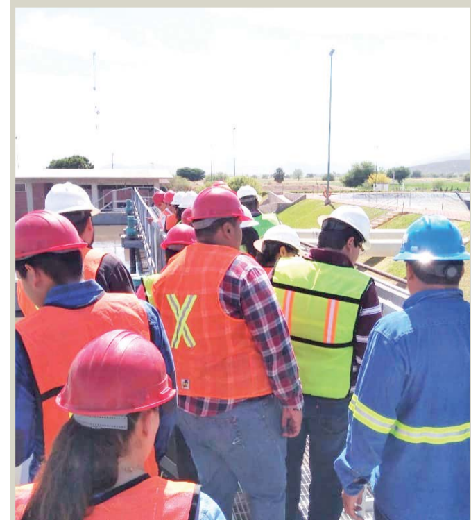
Los visitantes deben ingresar con la protección adecuada en caso de algún percance.