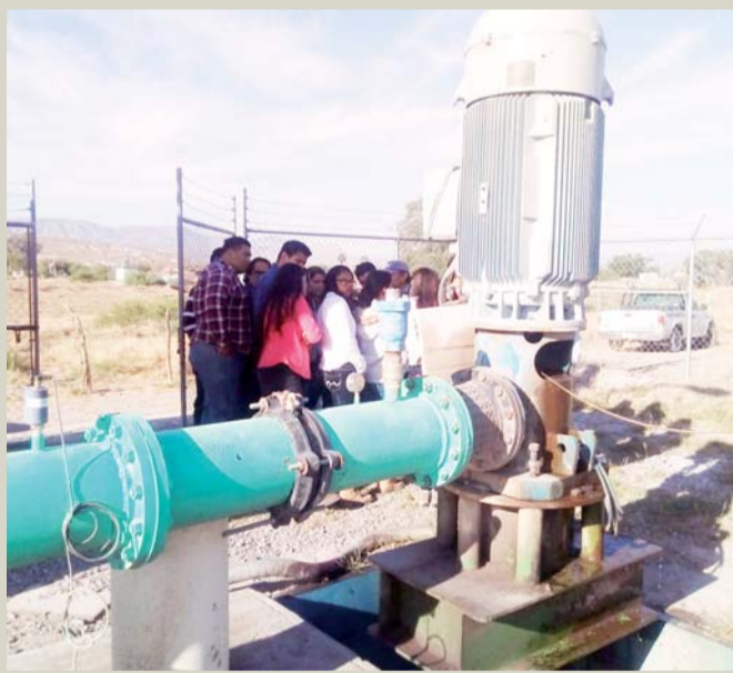
Alumnos aprenden en la Planta de Tratamiento de Aguas Residuales del municipio de Lerdo.

Lerdo, Dgo.