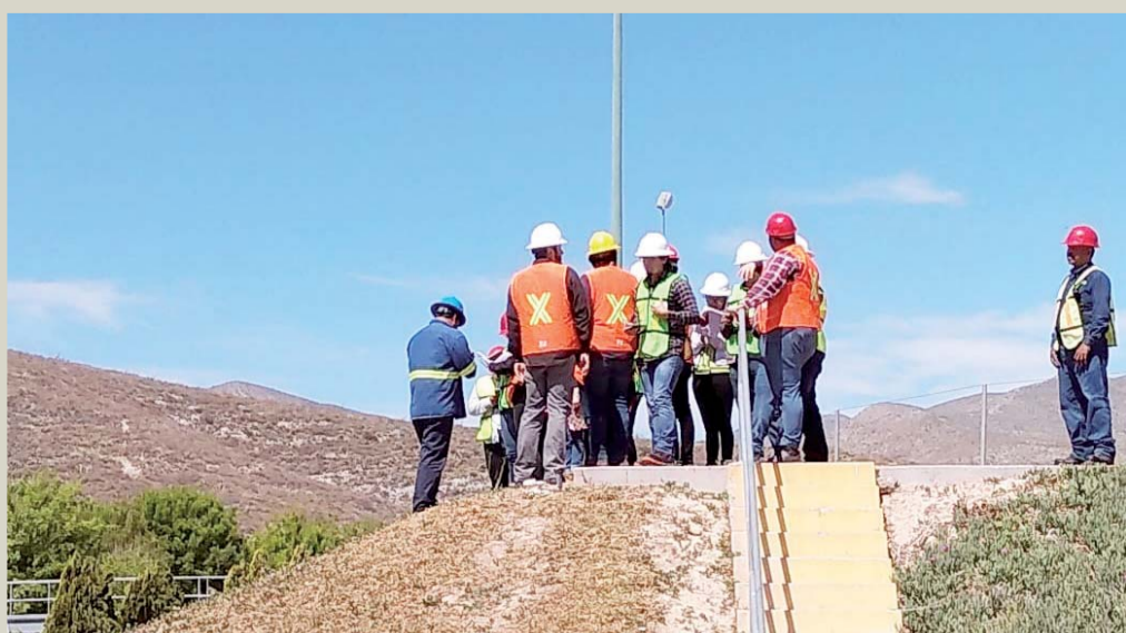
Los alumnos que acuden a las instalaciones hidráulicas muestran interés por las diferentes actividades que desarrollan los trabajadores de este centro.