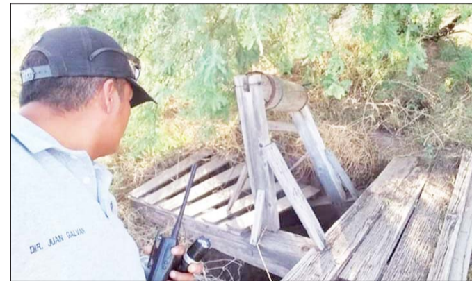
Ayuda. Habitantes de San Antonio de Ojo Seco se sumaron a las tareas de búsqueda del adolescente extraviado.