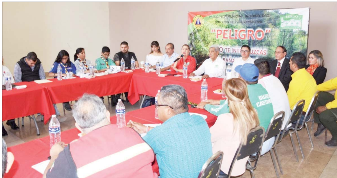
Acuerdos. Más de mil 500 elementos de diversas instancias participarán en el Operativo Semana Santa Segura 2019.

Dependencias se coordinarán para buscar reducir el índice de accidentes.