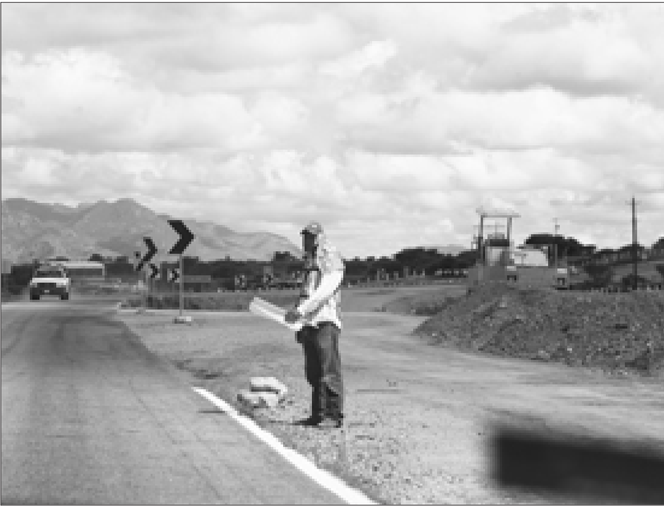
EL SIGLO DE DURANGO