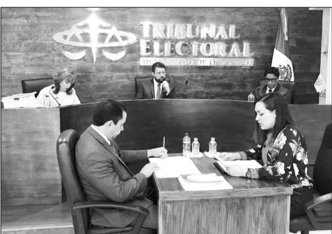
Resolución. Fue revocado el registro de la candidata de Morena a la alcaldía de Gómez Palacio.