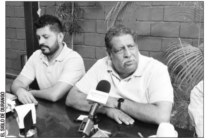
Asesoría. El Alcalde de Tlahualilo busca que la Presidenta de Gómez les auxilie para reducir las tarifas de la CFE.

Señaló que las tarifas de la CFE se han vuelto impagables, de ahí que está solicitando el apoyo de Leticia Herrera, a partir de que Gómez Palacio se convirtió en el único municipio del país en ganar un juicio a la empresa de energía eléctrica.