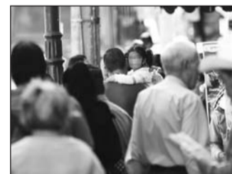
Se debe poner especial atención en los menores.

En la Cámara de Diputados del Congreso de la Unión se propuso exhortar a la Secretaría de Educación Pública (SEP) a que emprenda campañas permanentes de detección, atención y seguimiento psicológico a niñas, niños y adolescentes, que contribuyan a reducir y prevenir las violencias que les afectan, incluidas las autolesiones. Se precisó que, según la Organización Mundial de la Salud (OMS), toda violencia contra las y los menores, en particular el maltrato infantil en los 10 primeros años de vida, constituye un importante factor de riesgo.