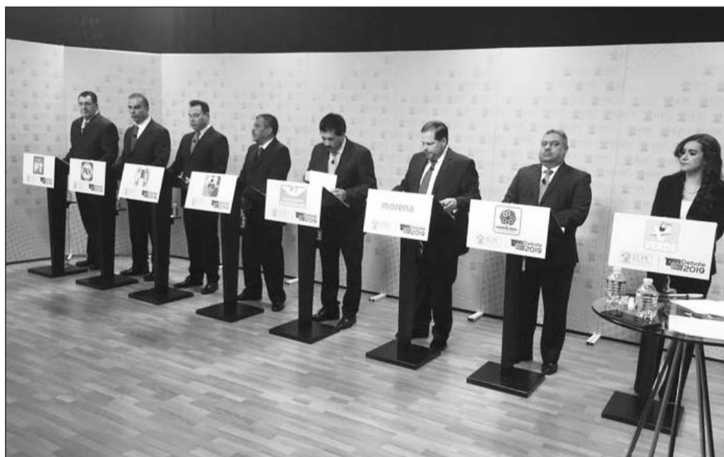
Saldo. Se hicieron algunos cambios en el formato, pese a lo cual, el debate no logró permear entre los electores.

tres municipios se programaron debates durante el actual proceso electoral.