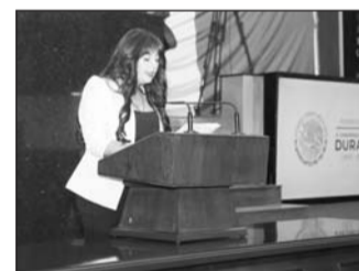
Se pretende fortalecer la legislación vigente.

En el Congreso del Estado se propuso establecer en la legislación la obligación de cualquier ente, ya sea público o privado, de no iniciar ninguna obra en la vía pública si no es con la autorización y supervisión permanente del Ayuntamiento, desde el inicio hasta la culminación de estas. Dicha reforma a la legislación secundaria en materia de desarrollo urbano tiene un fin concreto, la protección y salvaguarda de la autonomía municipal, a su vez que el cumplimiento y encuadre a ley sea por todos acatada.