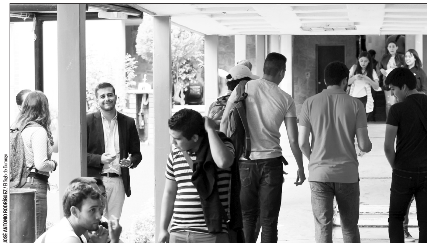
Recursos. A decir del rector se tendrá que definir cómo harán frente las instituciones al gasto operativo.