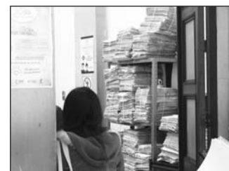
Buscan la forma de “obligarlos” a pagar.

En el Congreso del Estado se promueven reglas para el pago de pensión alimenticia a través de una iniciativa que presentó el diputado Pedro Amador Castro. El legislador hizo referencia a que el cónyuge que se haya separado del otro, sigue obligado a cumplir con los gastos alimentarios. Asimismo, expuso que en Durango el 80 por ciento de los deudores que están obligados a cumplir, no paga la pensión alimenticia, por lo que en el caso de las mujeres con bajos recursos no tienen la oportunidad de seguir manteniendo a los menores.