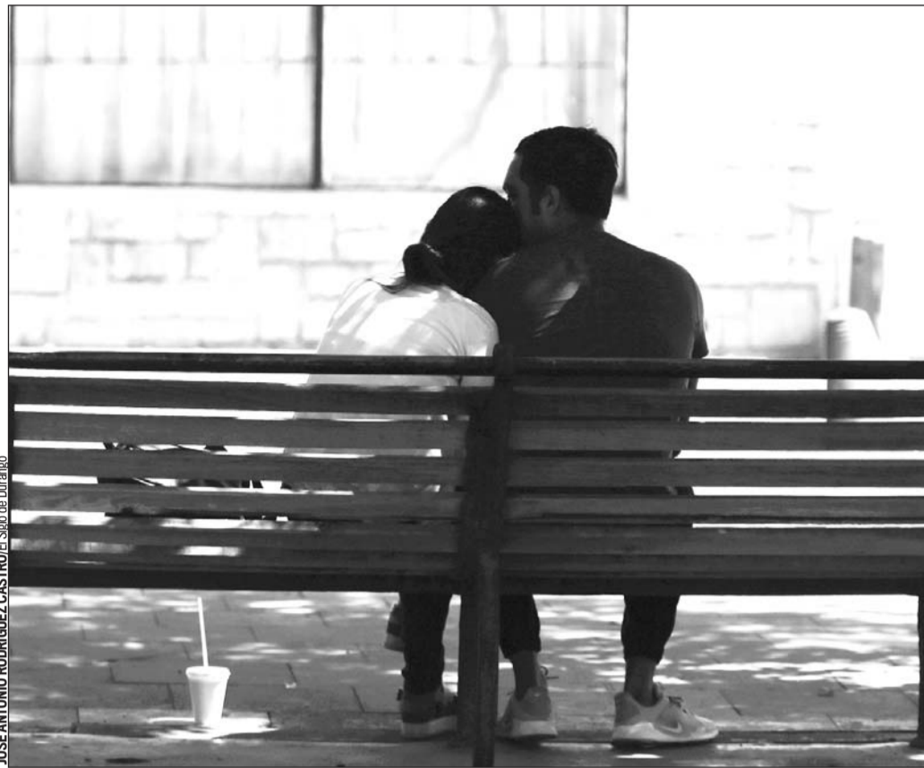
Estigma. Los pacientes con VIH o SIDA aún son estigmatizados, incluso por sus familias, ello inhibe que acudan a recibir atención médica pese a que está probado que pueden llevar una vida regular.

El que Durango presente pacientes menores de 20 años de edad es un factor