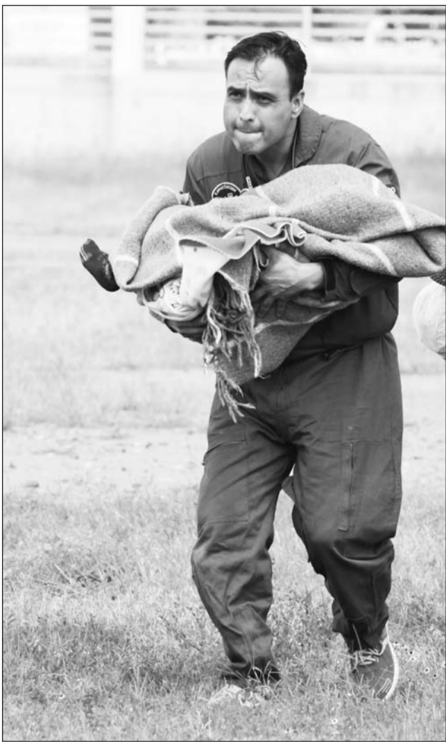
Urgencia. Tras la picadura de un alacrán la recomendación es acudir urgentemente a un centro médico para recibir atención.