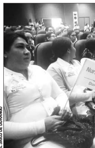
Participantes. Enfermeras de diversas instituciones se sumaron a la campaña internacional.

La intención de la campaña también es empoderar a las enfermeras que acaban de festejar su día internacional el 12 de mayo.