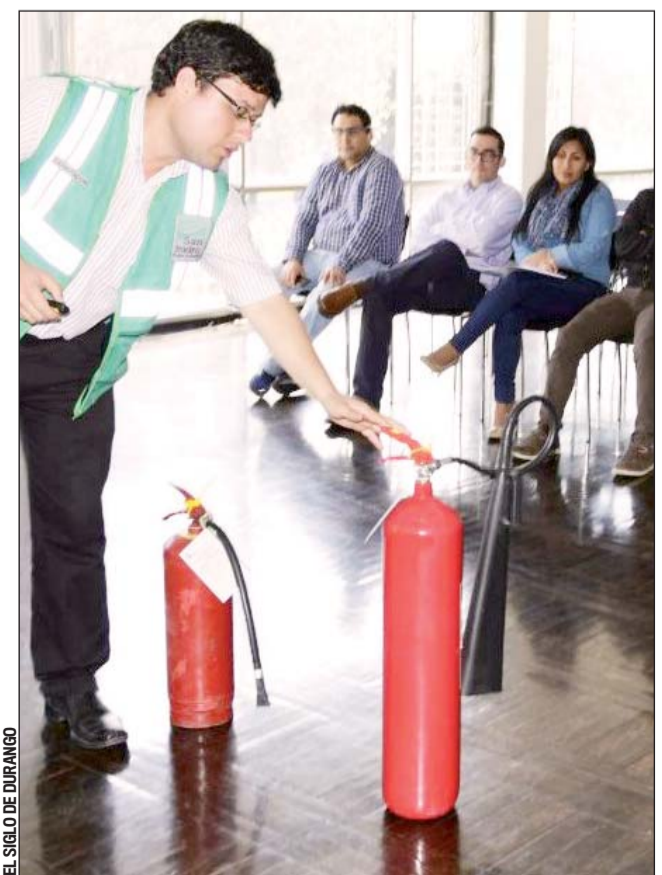
Extintores. Todo nuevo negocio que busca el permiso de apertura gasta al menos en adquirir extintores.

A través de la página de internet se calendariza las reuniones en las diferentes direcciones donde se tiene que sacar un permiso.