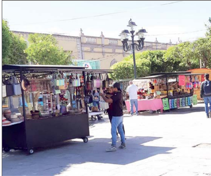
Comerciantes. La plaza de Armas se encuentra saturada de comerciantes, incluso muchos de ellos están de manera informal sin que nadie los retire, a esto se le suman las ferias artesanales que se realizan ya de manera muy frecuente.