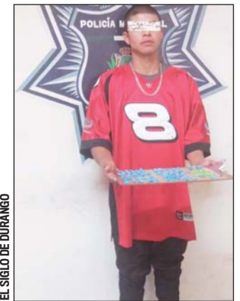
Además de dedicarse a la venta de energizantes, el sujeto también los consumía.

La semana inició con una decena de choques matutinos en los que, por fortuna, los daños fueron predominantemente materiales. Tan solo en el bulevar Guadiana, en el tramo del "Baluartito" al paso elevado de la Normal se dieron cuatro percances, mientras que otros ocurrieron en bulevar Durango y avenida Zacatecas. Sin embargo uno de los más aparatosos se dio en Francisco Villa justo frente a la Estación Oriente de la Dirección de Seguridad Pública, donde hubo tres lesionados no graves.