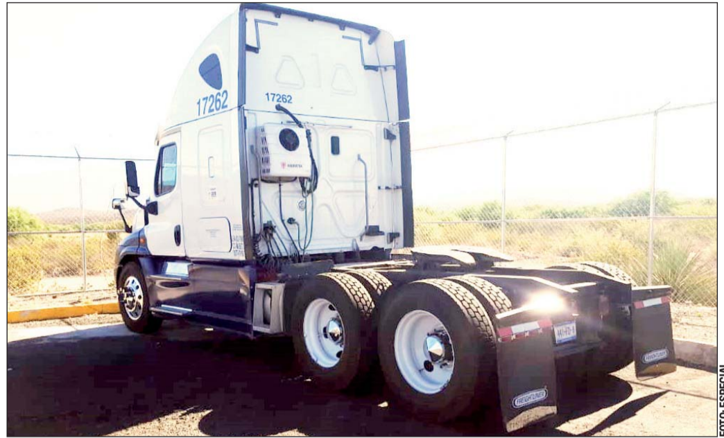
Hallazgo. El tractocamión fue localizado pero aún se busca la caja refrigerada.

El proceso fue normal hasta pasar el puente El Ba-