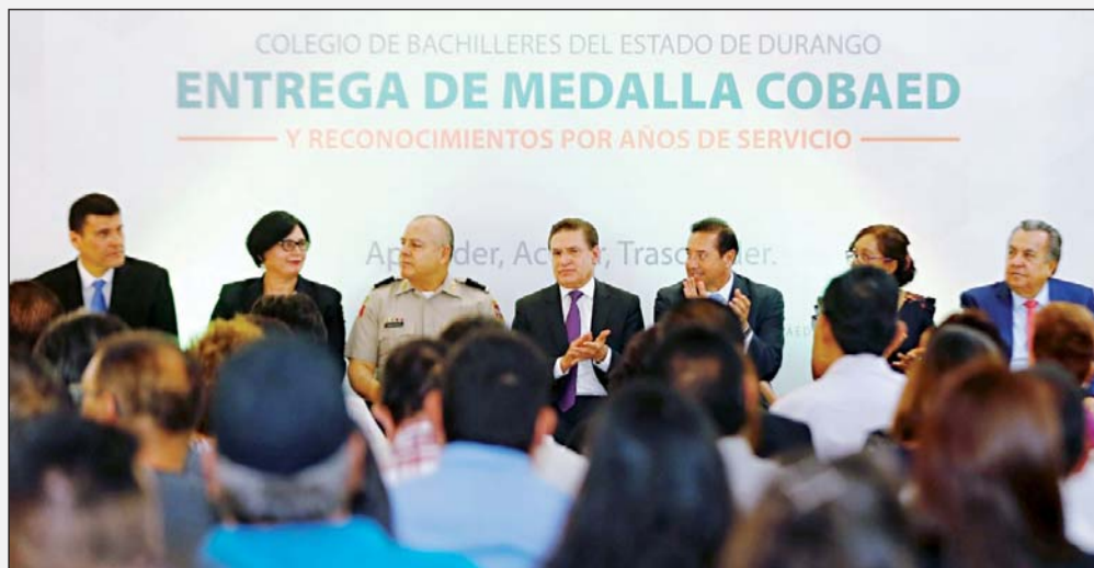
Un total de 350 trabajadores del Cobaed, docentes y administrativos fueron homenajeados.

Reconoció la labor de los maestros y personal administrativo por entregar años de su vida a ese servicio tan noble como lo es la docencia.