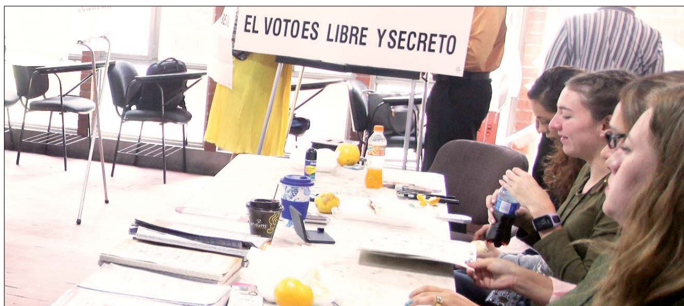
Circunstancias. Aseguran que el Gobierno del Estado se ha mantenido ajeno a los candidatos que participan en el Proceso Electoral en curso.

cómputo y cobertura de internet en todos los planteles, y la homologación de 200 plazas que benefician en el salario al mismo número de empleados.