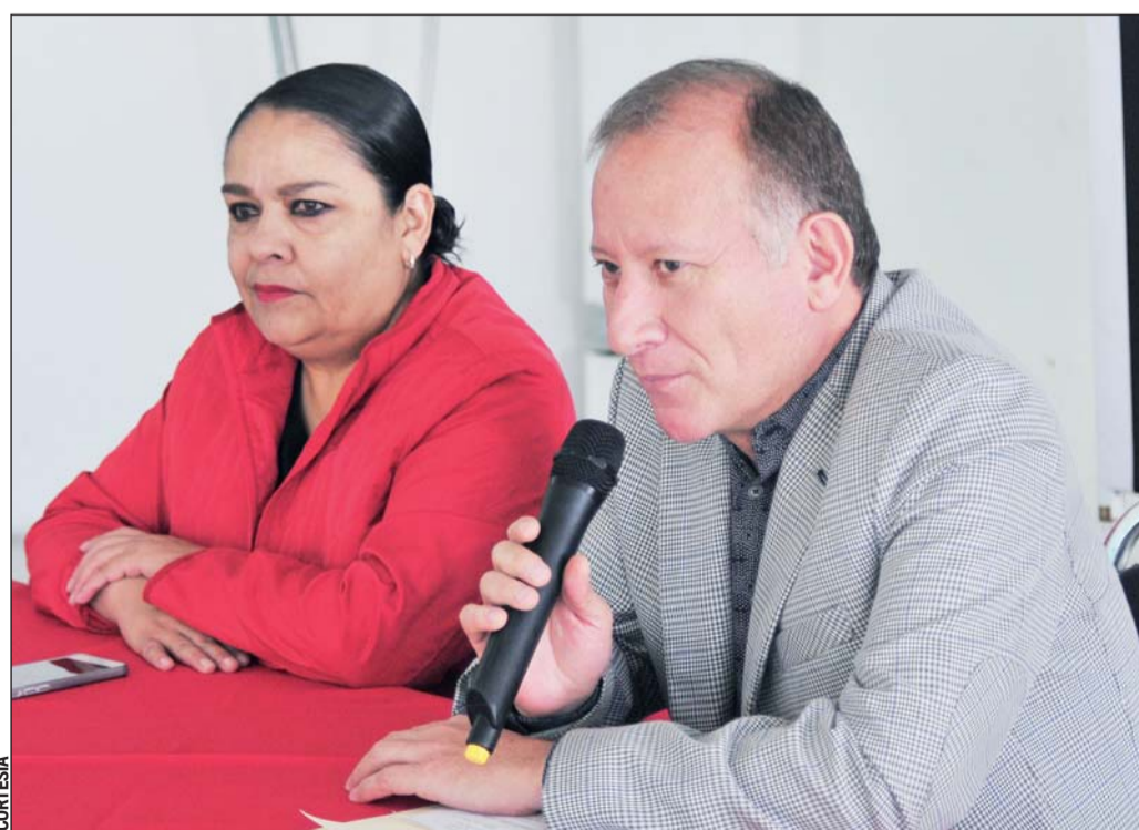
Extra. Del 8 al 10 de noviembre Durango será sede de la séptima edición del concurso nacional de piano, este año con la participación de jóvenes de seis estados.

De acuerdo al programa oficial que se presentó a los medios locales, las actividades comenzarán a las 10:30 horas con una primera fase