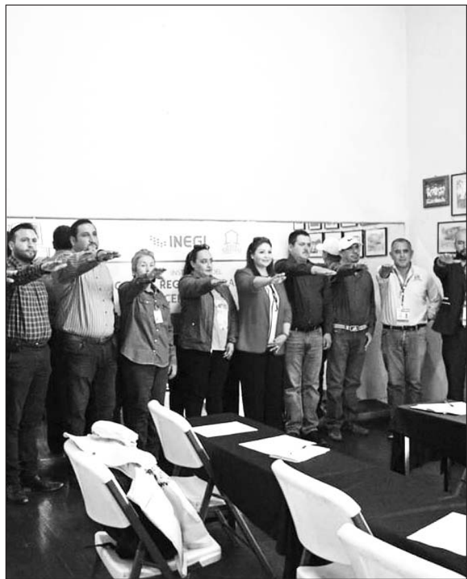
Comité. Canatlán se suma al Comité Regional para llevar a cabo el Censo de Población y Vivienda 2020.

ANDREA TERÁN EL SIGLO DE DURANGO Canatlán, Dgo.