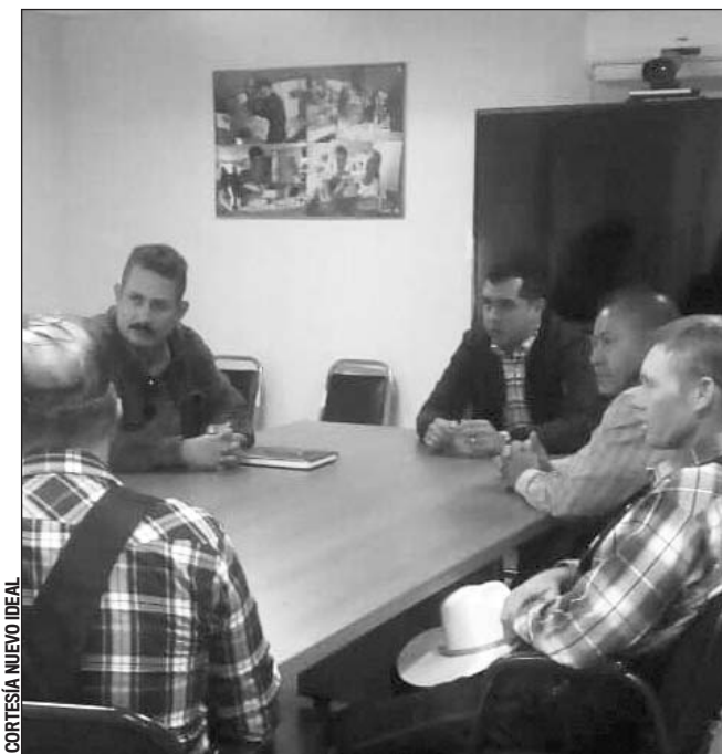
Proyecto. Ya se afinan los detalles para que Liconsa pueda comprar leche de los menonitas.

El Censo de Población y Vivienda 2020 tiene como objetivo principal actualizar la cuenta de la población residente del país, así como la información sobre su estructura y principales características socioeconómicas y culturales, además de su distribución en el territorio nacional; del mismo modo la cuenta del total de viviendas y sus características, sin perder, en la medida de lo posible, la comparabilidad histórica a nivel nacional e internacional.