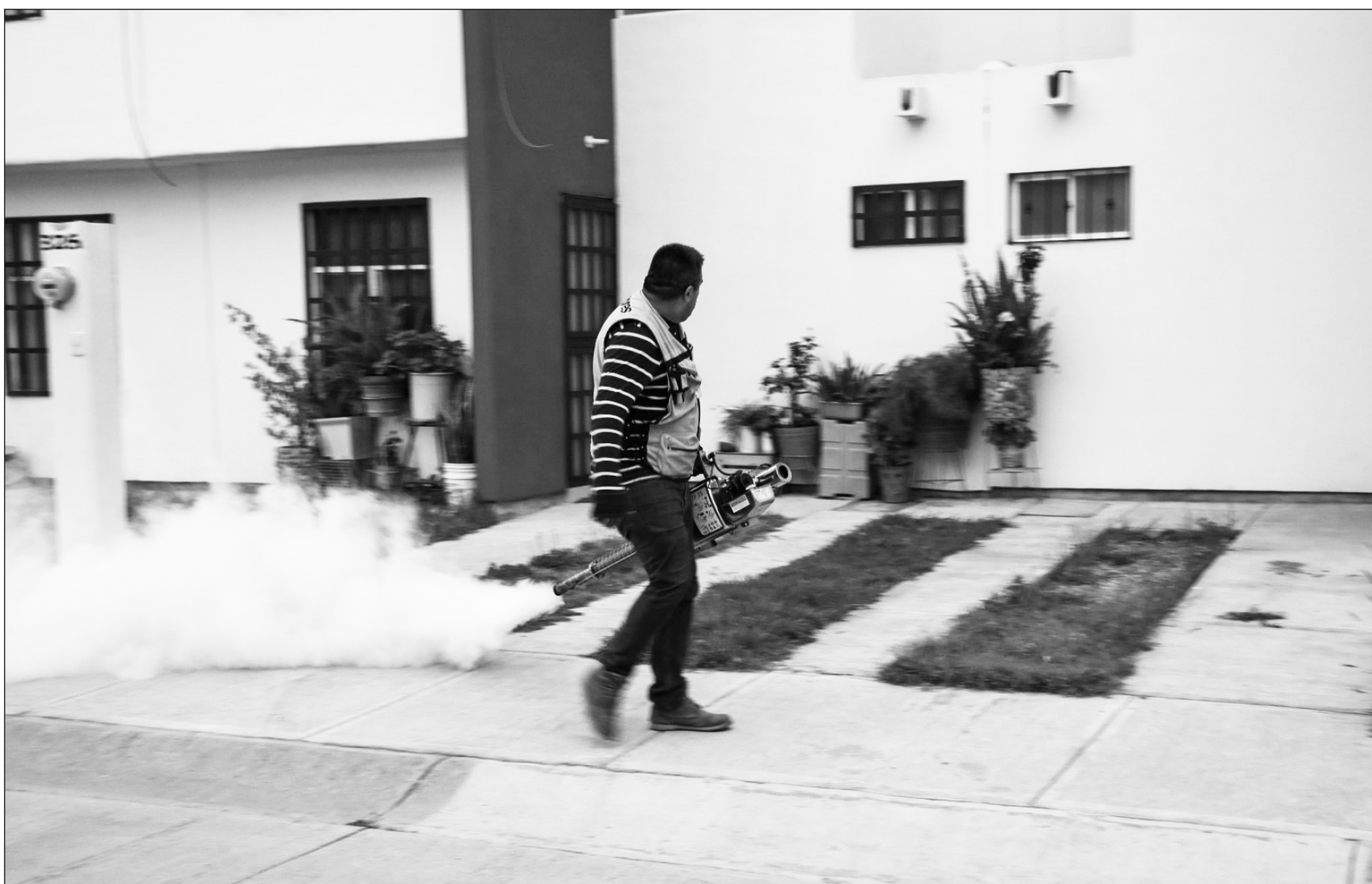
Nebulización. Hoy se llevará a cabo otra parte de la nebulización en la cabecera municipal de Topía.

Señaló que “suspeitamente el foco de infección es en inmediaciones del Barrio El Almirez”, por lo que se va a llevar a cabo un control larvario así como un muestreo entomológico, además de recolección de un muestreo de larvas para su análisis.