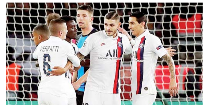
Perfecto. El PSG tiene paso perfecto en la Champions League.