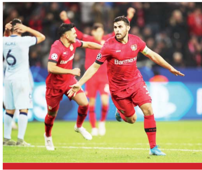
Derrota. Atlético de Madrid cayó en su visita a Alemania ante el bayer Leverkusen.

"Las cosas están pasando más rápido de lo que podía pensar, pero estoy entrenando para eso", señaló.