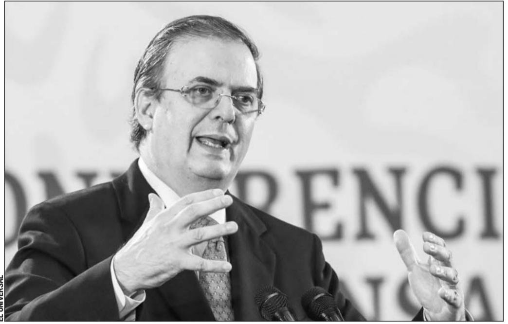
Colaboración. “La FGR tendrá que determinar de acuerdo al tratado de cooperación México-Estados Unidos sobre asistencia jurídica mutua, que es un tratado vigente, la Fiscalía General de la República tendrá que determinar si requiere otro tipo de apoyos, por ejemplo, del FBI”, dijo.

El canciller explicó que luego de confirmarse que