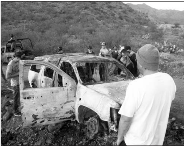
Intervención. “Si México no puede controlar su territorio, Estados Unidos tendrá que hacer más para proteger a sus ciudadanos en ambos lados de la frontera”, dijo el diario.