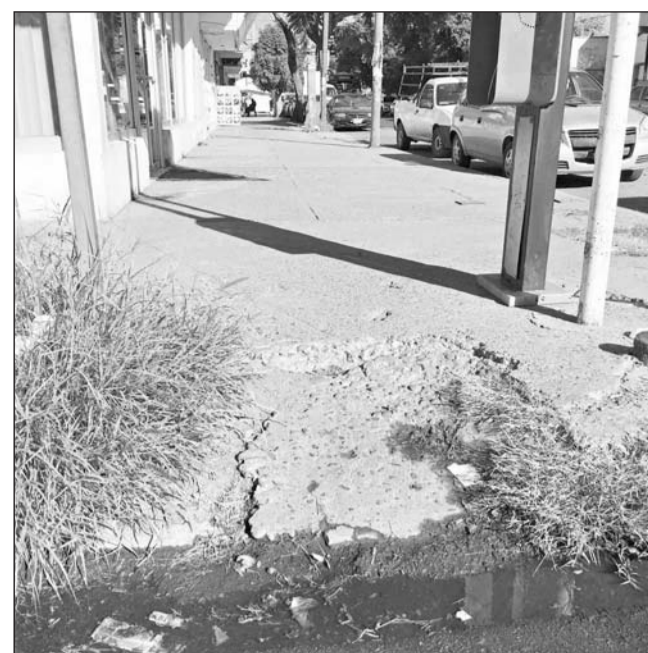
Proyecto. La rehabilitación de las banquetas es uno de los proyectos que impulsado en el Fondo Metropolitano.