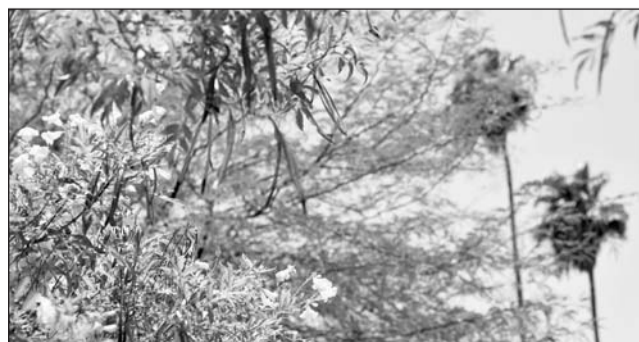
Concurso. Facultad de Ciencias de la Salud gana concurso del primer Congreso de Salud Mental y Medio Ambiente.