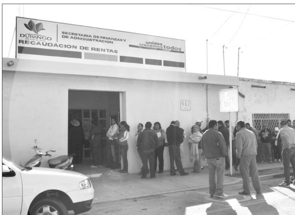
Recorte. Un recorte de 6 millones 300 mil pesos, lo que representa el 40 por ciento menos de lo que se esperaba.

“De la secretaría de finanzas ha habido algún retraso, pero bueno, a veces tenemos que hacer las gestiones administrativas cada uno de los presidentes municipales y más bien, a través de los tesoreros municipales, necesitan ponerse a arrastrar el lápiz para ver cuánto nos deben, en el caso de Lerdo si venía retrasado porque dice la Ley y está publicado en el Diario Oficial