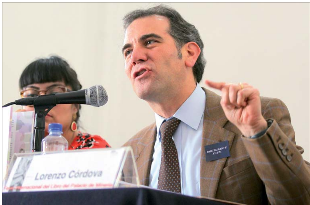
Ejemplo. Aunque el consejero no situó su advertencia en México, expuso que ante problemas extraordinarios "también los controles a los poderes deben tener una dimensión extraordinaria".