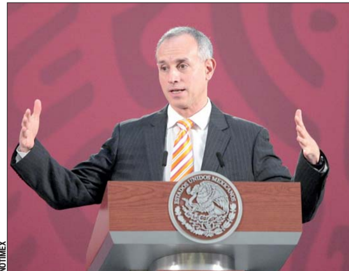
Justificación. Hugo López-Gatell Ramírez aseguró que cada nación mantiene un modelo diferente de vigilancia epidemiológica.

Pidió que, con datos de la OMS se revisara cuántas defunciones han habido en América Latina y cuál es la población de cada uno de los países.