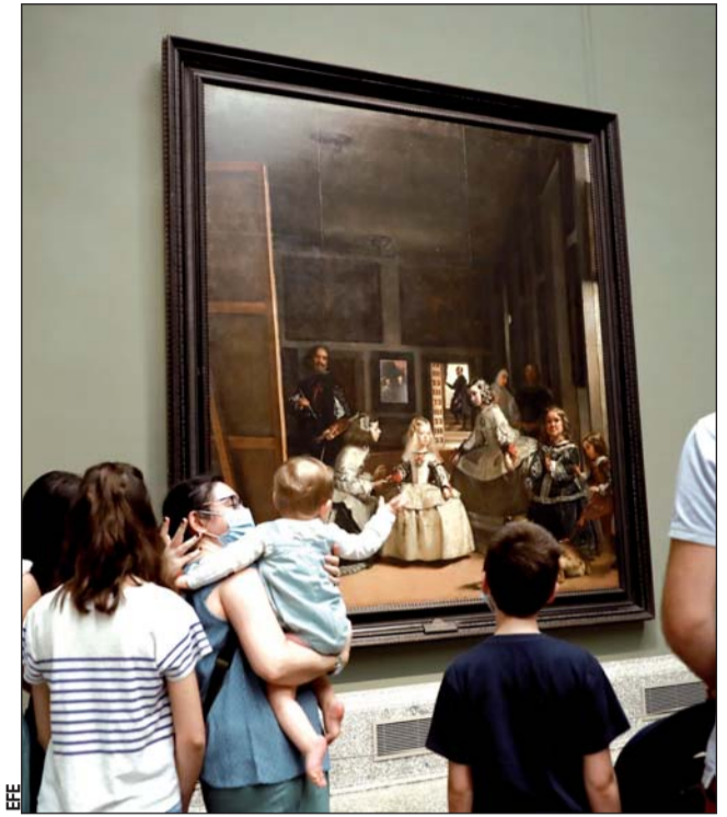
Visita virtual. Ya sea en cuentas oficiales o de usuarios, se pueden observar algunas salas de los museos en el mundo.

En 1976 consiguió el Premio ‘Quetzalcóatl’ por ‘Hasta en las mejores familias’; el Primer Premio del Concurso de Cuento en Francés 1977 por ‘Deuxième Pont’; el Premio Nacional de Novela ‘Juan Grijalbo’ 1978 por ‘El vampiro de la colonia Roma’, entre otros.