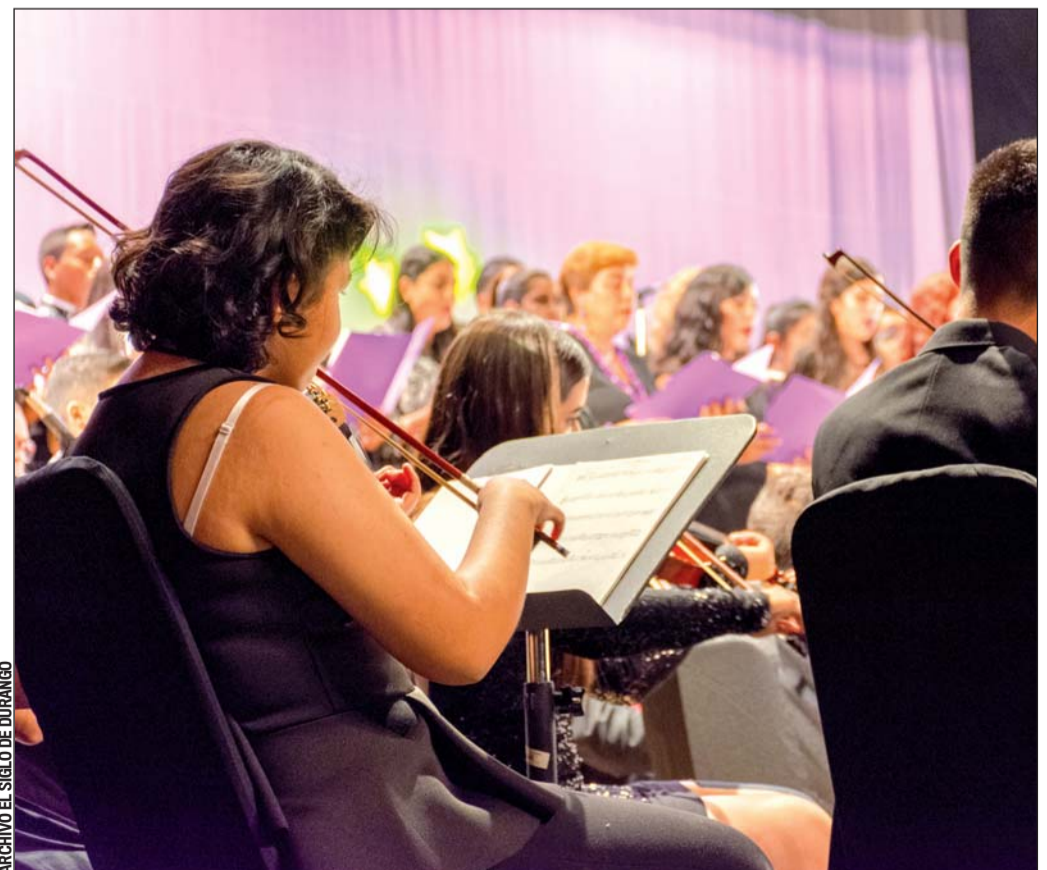
Extra. Salazar abordará parte de la historia y características de la música clásica dentro del programa ‘Notas de música’ que coordinan dependencias municipales.

“Los conciertos de este género musical suelen tener una atmósfera solemne, se espera que el público esté en