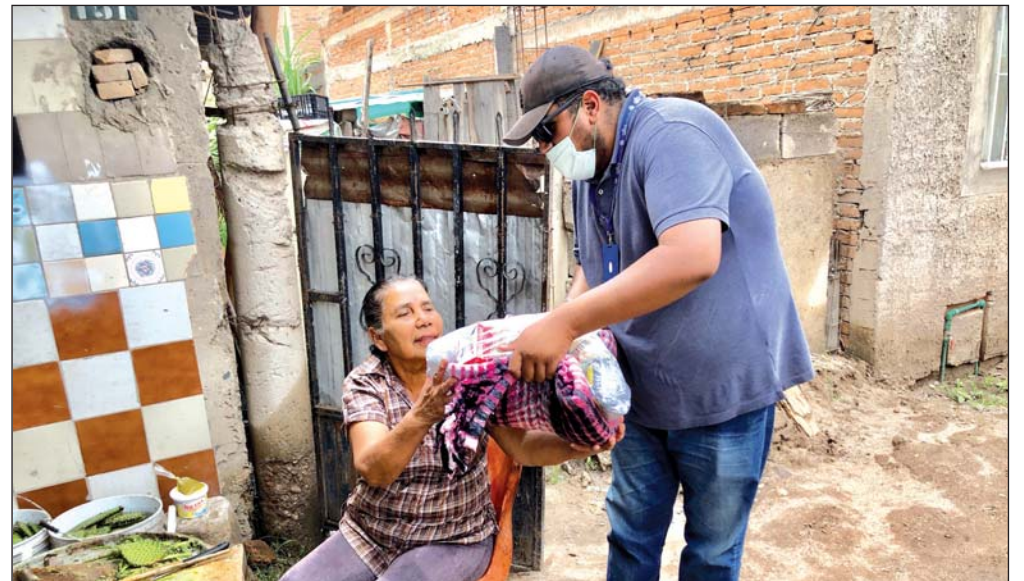
Siguen atendiendo diversos poblados y colonias de la capital en coordinación con varias dependencias estatales y municipales.

difíciles, no escatimaremos en apoyos para las familias que viven en las condiciones más adversas,