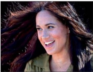
Meghan, de 38 años, busca daños y perjuicios de la editora.

Los abogados de la duquesa de Sussex pidieron a un juez en Londres que mantenga fuera del dominio público los nombres de cinco amigas de Meghan, quien libra una batalla contra un diario británico por violación de privacidad. Un abogado de Meghan dijo que las amigas, que la defendieron en entrevistas anónimas con una revista el año pasado, son personas inocentes que temen ser importunadas si sus nombres se publican. El blanco de su demanda, Associated Newspapers Ltd., argumenta que el principio de la justicia abierta -el derecho del público a saber- implica que las amigas deben ser identificadas. Meghan señala abuso de información privada, violación de derechos de autor y de protección de datos. (AGENCIAS)