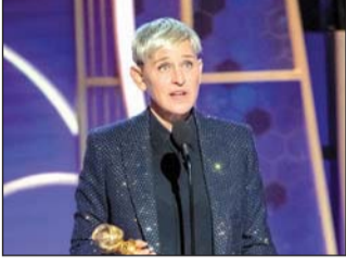
Uno de los productores abandonaría el programa.

"Obviamente, algo ha cambiado y estoy decepcionada de saber que no ha sido así. Y por eso, lo siento", añadió. (AGENCIAS)