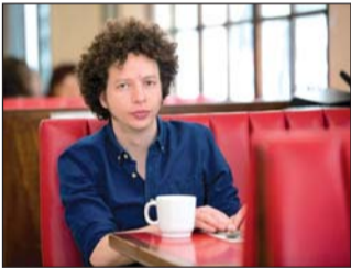
La selección estaba muy lejos de la de una edición normal.

Previsto del 10 al 19 de septiembre, ha programado un festival virtual para su 45ª edición debido a la pandemia. En situaciones normales, es el festival de cine más grande de Norteamérica. Este año redujo drásticamente sus planes y juntó 50 películas o series de TV, inclinándose por proyectos que debutarán en servicios de streaming o televisión este otoño boreal. (AGENCIAS)