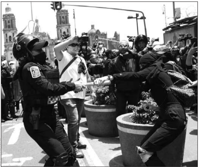
Saldo. La movilización generó roces entre manifestantes y policías, de las cuales ocho resultaron con lesiones.

Antes de comenzar la marcha, varias policías acudieron al núcleo de las marchantes para llegar a acuerdos y lograr hacer el recorrido de manera pacífica.