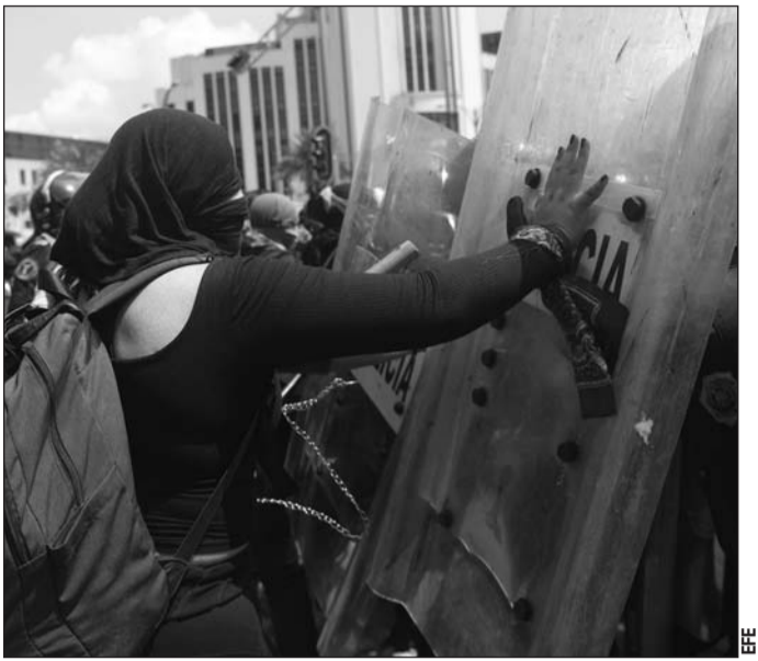
Movilización. Durante la protesta, las mujeres que marcharon exigieron avances en la despenalización del aborto.