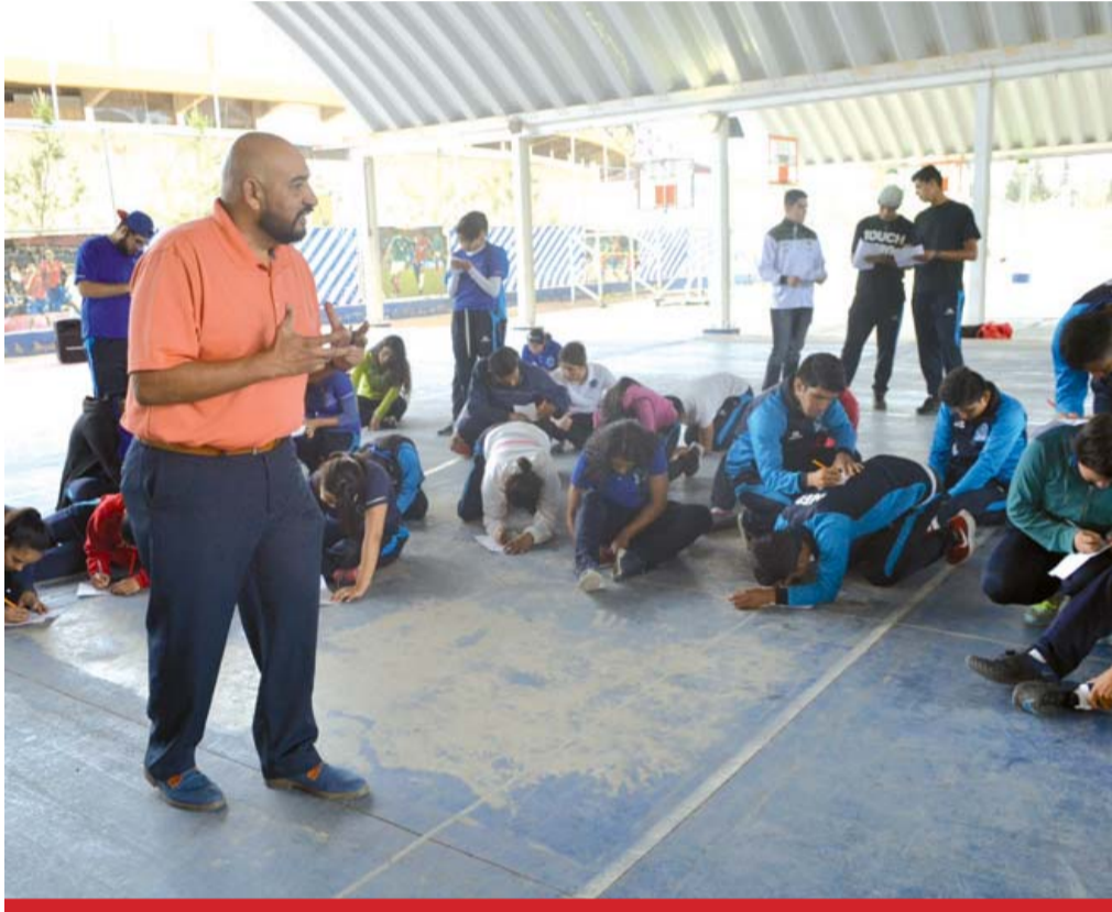
Actividad. Invitan a Congreso Internacional Online de Educación Física.

Para este importante Congreso internacional Online se contarán con ponentes de Colombia, México y Perú, y es dirigido a los profes-