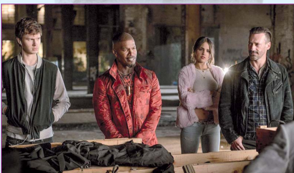
Otro de los papeles más importantes y con el que brincó a la fama es en el filme "Baby Driver".

Esta carta para su madre al parecer se convirtió en un decreto de éxito para la joven actriz, que además le dedicó una posdata muy especial; "Lo primero que comprando sea cantante, va a ser la casa de mi mamá, donde ella quiera". Sin duda la actriz cumplió todos sus objetivos de vida, aunque tal vez dejó de lado su carrera musical, Eiza no ha descuidado su verdadera pasión que es la actuación.